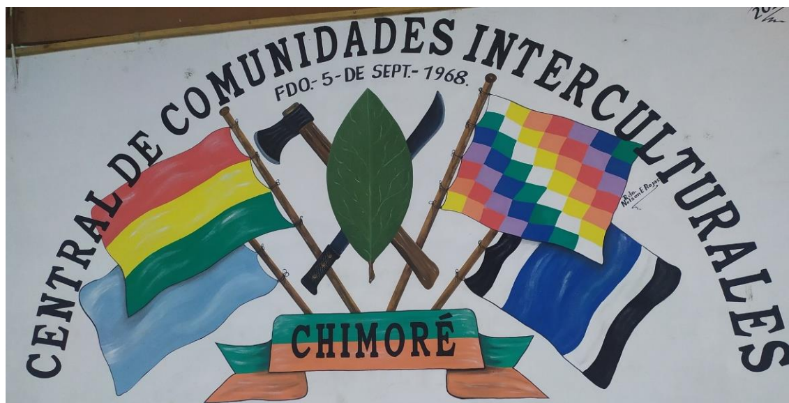
Figura 1. Logo de la Central de Comunidades Interculturales de Chimoré.