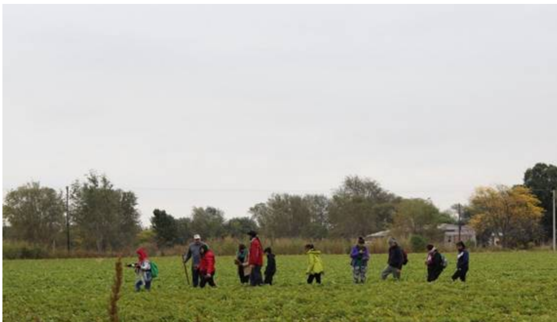
Figura 2 Cosecha en el campo agroecológico de batatas