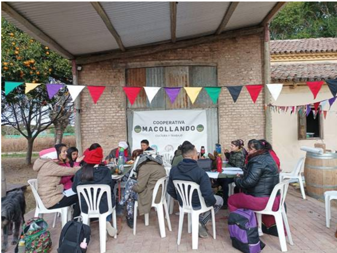
Figura 4 Trabajo en grupos en el tercer encuentro

En la Figura 4 se puede vislumbrar la participación en grupos del último encuentro.