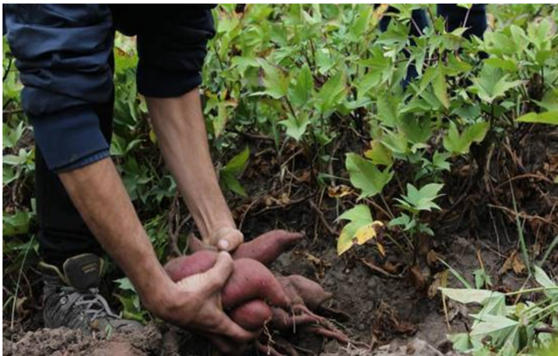
Figura 1 Batatas agroecológicas Crédito de autores