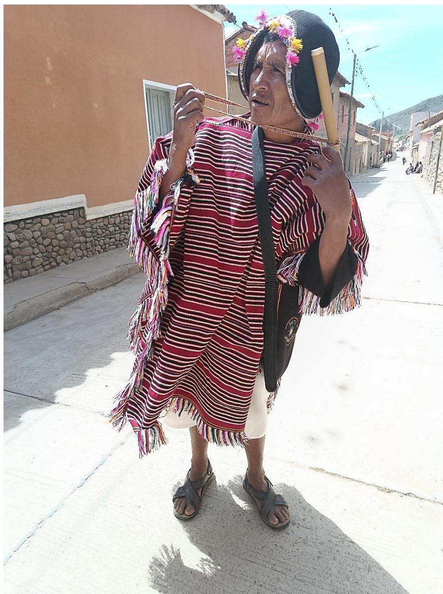
Figura 2. Preparándose para la fiesta del Pujllay. Tarabuco, marzo 2024.