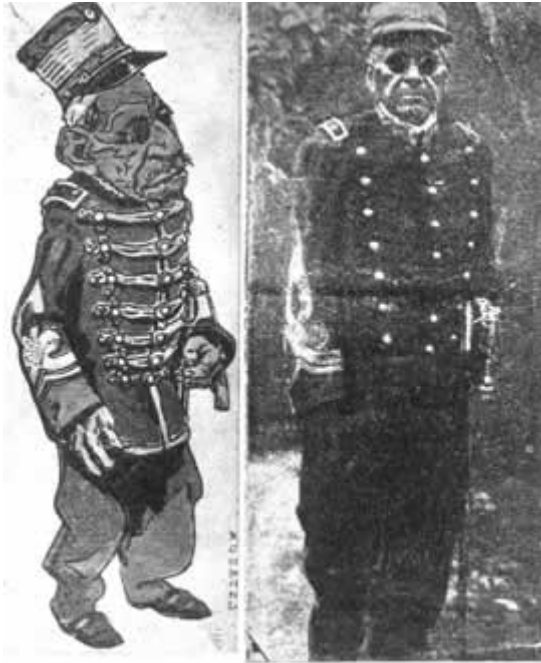
Caricatura del cacique Namuncurá con Cao, publicada en 'El Heraldo' y reproducida en 'El Heraldo'.