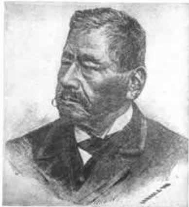
Retrato de Namuncurá, como civilizado, en el 'El Heraldo'.

Además, les presento a "Namuncurá de civil", un excelente trabajo de autor desconocido para mí publicado en el libro de Clifton Goldney (op. cit).