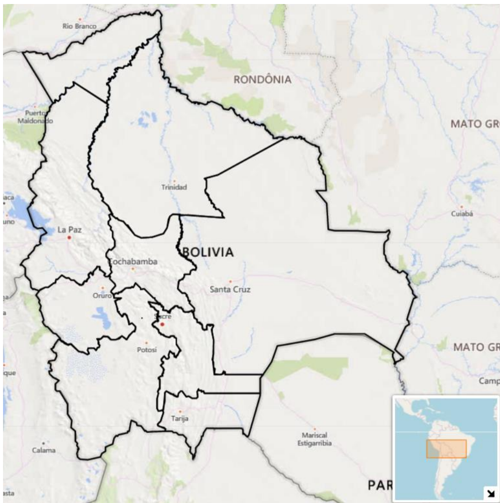
Mapa 1: División político-administrativa departamental de Bolivia.

Bolivia está organizado en nueve Departamentos: Pando, Beni, Santa Cruz, Tarija, La Paz, Cochabamba, Oruro, Potosi y Chuquisaca (ver mapa 1). Al igual que los municipios, los Departamentos poseen una existencia previa a la aprobación del nuevo texto constitucional. Funcionan como auténticas entidades políticas subnacionales.