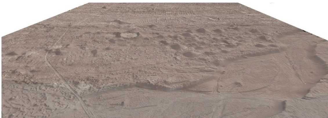
Figura 2: Modelo 3D del sitio arqueológico, túmulos y acondicionamientos agrícolas (Elaborado por Roberto Izaurieta, 2021).

Los túmulos alcanzan alturas entre 0,5 y 2,5m desde la superficie actual. Sin embargo, mediciones geofísicas dan cuenta de una proyección de hasta 1,5m bajo el suelo, al menos. Se trata de montículos construidos de tierra mezclada con gran densidad de restos vegetales y desechos reubicados y depositados a modo de ofrendas, correspondientes a materiales de períodos distintos. La distribución espacial permite reconocer dos conjuntos principales, conjuntos menores y túmulos aislados. Dentro de los primeros, el conjunto Central está compuesto por 108 túmulos ubicados en el sector sur adyacente al cauce; el conjunto Norte se compone de trece túmulos, siendo más pequeños y menos visibles que los anteriores. En ambos casos, los túmulos aparecen dispuestos en semicírculo abierto al sur, a modo de anfiteatros, circundando y conteniendo actividades en sus espacios interiores. Mientras que en el conjunto Norte predomina el material del período Formativo, en el conjunto Central abundan materiales de todos los períodos, sobre todo del Intermedio Tardío y Tardío (Uribe et al. , op cit. ).