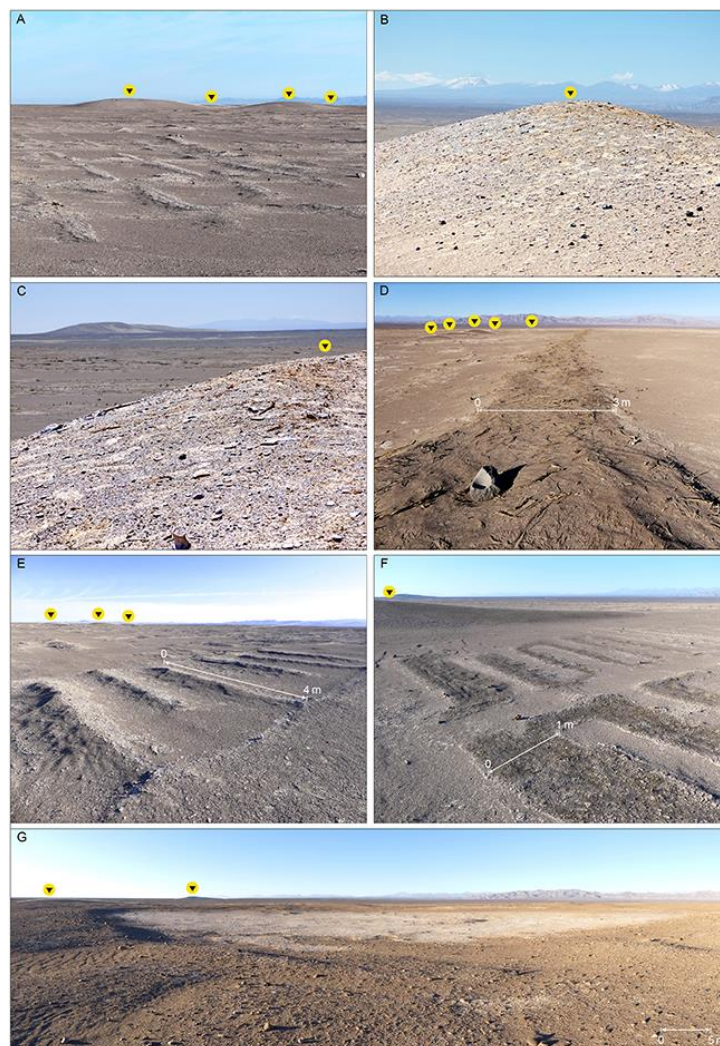
Figura 3: Vistas del sitio arqueológico Iluga Túmulos (Elaboración FONDECYT 1181829). A) Túmulos del conjunto Central y acondicionamientos tipo Eras; B) Túmulo y cerro nevado Tata Jachura al fondo a la izquierda. C) Detalle de materiales del túmulo y cerro Unita al fondo; D) Canal principal y túmulos del conjunto Norte al fondo; E) y F) Acondicionamientos agrícolas y de riego; G) Estructura circular de barro, probable estanque (diámetro 60m)

Frente a lo anterior, ciertamente, llama la atención que el sitio Iluga Túmulos parezca haber sido olvidado entre las comunidades contemporáneas, del mismo modo que quedara archivado en las indagaciones arqueológicas hasta ahora. Si bien no se alude explícitamente en cuanto a usos y significados tanto sagrados como ceremoniales de este lugar, condición que sí trasunta cerro Unita, la gravitación de la pampa aún encarna historias agrícolas ancestrales como que seguían sembrándose como tierras temporales hasta mediados del siglo XX.