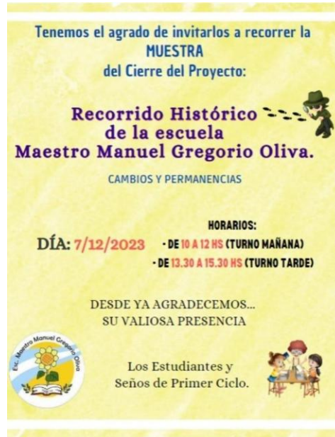
Figura 4: Invitación a la Muestra de Cierre del Proyecto (Cortesía de Viviana Garvales).