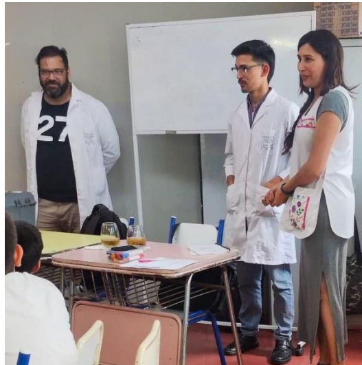
Figura 3: Visita a la Escuela Municipal nº 35 “Maestro Manuel Gregorio Oliva” (Tomada el 17/11/2023).

como en la coordinación de encuentros presenciales (Fig. 3).