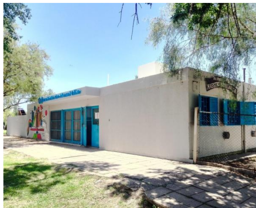
Figura 1: Escuela Municipal N°35 “Maestro Manuel G. Oliva” (Registro fotográfico personal).

A través de la búsqueda en internet se obtuvieron, en entre otros resultados, información de las instituciones educativas municipales (de la ciudad de Córdoba, Prov. de Córdoba, Argentina), entre ellas, la Escuela Municipal “Maestro Manuel Gregorio Oliva”, fundada el 26 de marzo de 1986, originalmente como una guardería del Gremio de Empleados de Comercio (Fig. 1).