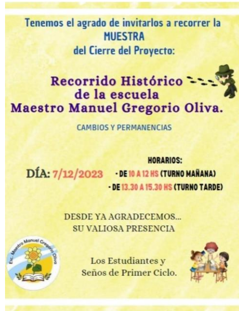
Figura 4: Invitación a la Muestra de Cierre del Proyecto.