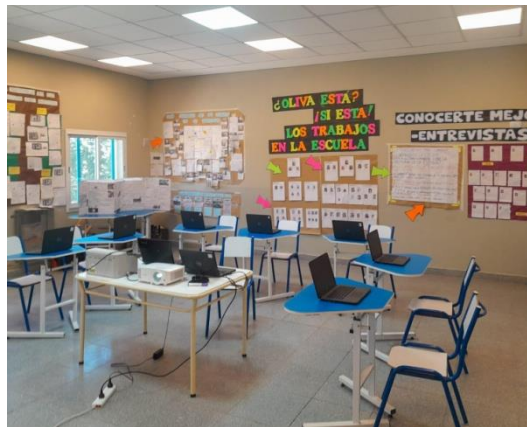
Figura 5: Muestra de Cierre del Proyecto.