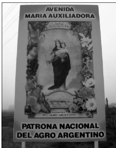
Figura 5: Santuario de María Auxiliadora. Fortín Mercedes. http://maria-auxiliadora-patrona-nacional-del-agro-argentino.es.tl/24-de-Mayo%2C-fiesta-de-Mar%EDa-Auxiliadora.htm