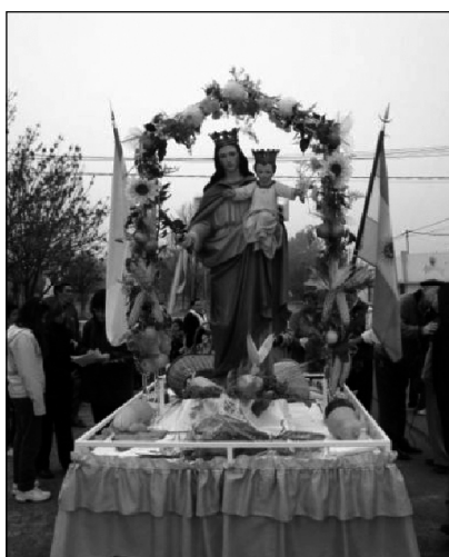
Figura 6: Santuario de María Auxiliadora. Fortín Mercedes. http://maria-auxiliadora-patrona-nacional-del-agro-argentino.es.tl/24-de-Mayo%2C-fiesta-de-Mar%EDa-Auxiliadora.htm