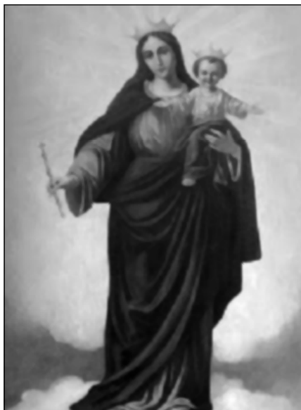
Figura 3: Pintura de María Auxiliadora en Villa Colón. Cuadro de Rollini. Centro de Espiritualidad Misionera. Hijas de María Auxiliadora. http://mornesamerica.blogspot.com/2010/04/el-cuadro-de-maria-auxiliadora-que-vino.html .