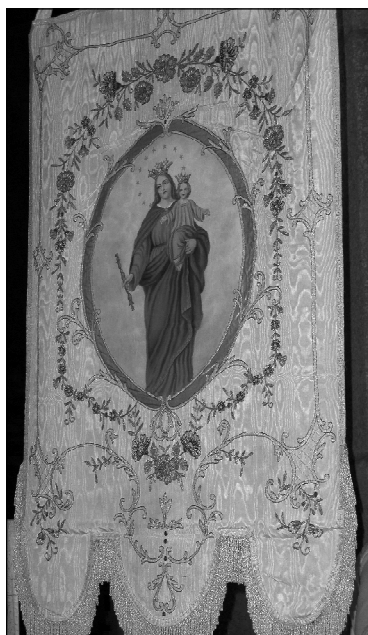
Figura 7: Fiesta de María Auxiliadora, Catedral de San Carlos de Bariloche, 24 de mayo de 2011.

“mesetas fértiles”, “vegetación lujurante” y los “panoramas más pintorescos imaginables”. El dispositivo transformador que marca territorio en Patagonia es la acción misionera y educativa de la Congregación que incorpora “a su civilización una región inmensa que a paso de gigante corre hacia el progreso” (Carbajal 1904:34). Surge entonces un tipo de actitud y de mirada hacia el espacio que “reivindica la tradición de tomar posesión, mediante la letra, de tierras que hasta el momento habían estado fuera de su alcance, en nombre de los valores que esta letra representa: la cultura, la civilización, la productividad” (Anderman 2000:109). En el texto, este dispositivo de apreciación sostiene la construcción de un espacio que pasa a ser por excelencia misionero y es narrado y mostrado como tal: un espacio oscuro, desértico y salvaje transformado en una tierra fantástica y exuberante, que pone serios obstáculos a la tarea evangelizadora, cuya transformación son producto de la acción civilizadora, transformadora y fundante de la Iglesia y el Estado, donde la acción salesiana se magnifica y transforma a la Patagonia en un espacio católico, salesiano y productivo. Como analiza Grusinski (2000:95), “la occidentalización instauro muchas referencias materiales, políticas, institucionales y religiosas destinadas a dominar las perturbaciones inducidas por la conquista”.