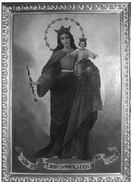
Figura 2: Pintura de María Auxiliadora. Cuadro de Rollini. Original de Mornese a Buenos Aires. Centro de Espiritualidad Misionera. Hijas de María Auxiliadora. http://mornesamerica.blogspot.com/2010/04/el-cuadro-de-maria-auxiliadora-que-vino.html