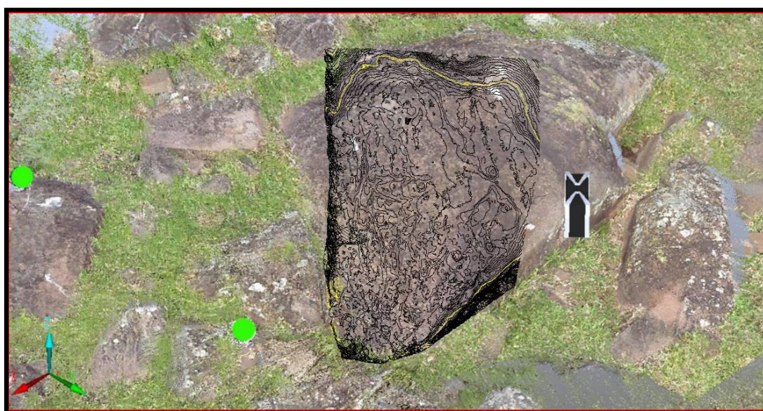
Figura 2: San Luis de Arapey (AR17G08). Detalle. Ortofotografía en vista superior, con curvas de nivel en un sector del bloque con grabados. En alta resolución el escaneo alcanza precisiones del orden de 1 mm de error en cada esfera de control (verdes).

En síntesis, el escaneo 3D y GNSS vino a sumar precisión y detalle a la profusa documentación generada en la última década (Cabrera 2008, 2012), ya que en los conjuntos más relevantes se contaba con levantamientos de posición de los grabados con Estación Total además de un completo registro documental y fotográfico.