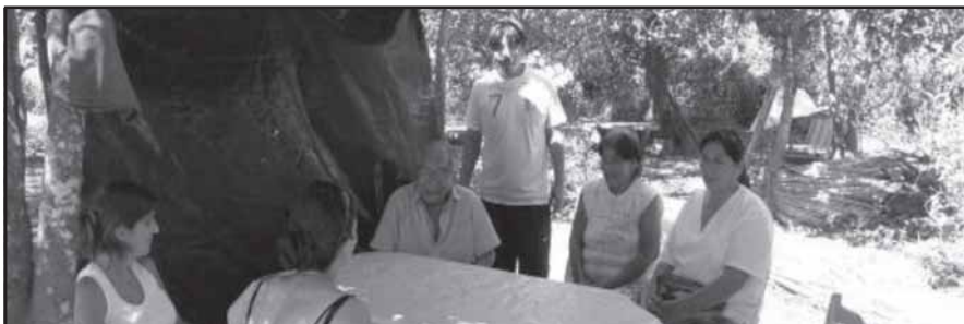
Taller realizado en marzo 2010 – Comisión Aim Mocoylek / Entrevista Flia. Salteño – marzo 2010.