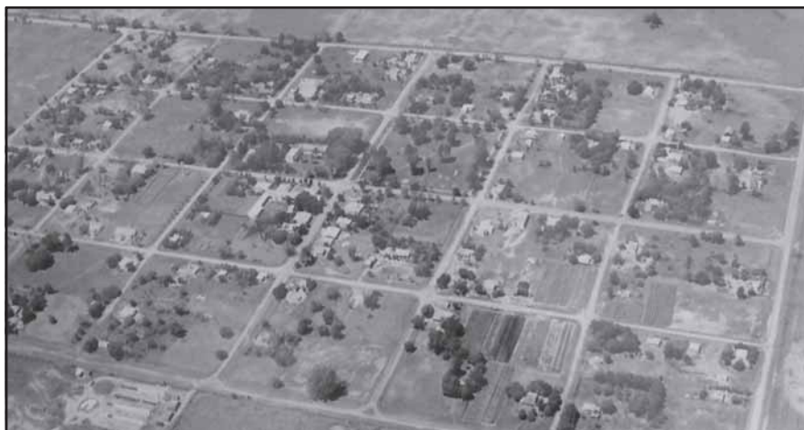
Fotografía aérea del Pueblo de Colonia Dolores, año 2005.

En el pueblo se encuentra la Escuela Primaria N° 430 y recientemente se ha creado el anexo de la escuela secundaria, Anexo N° 2359 dependiente de la Escuela de Enseñanza Media N° 359. En cuanto a servicios asistenciales, en la zona urbana encontramos un Dispensario de salud dependiente del SAMCO Nro. 3.