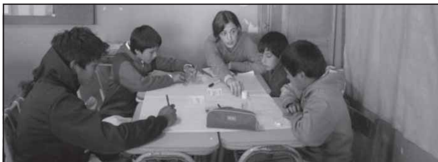
Taller realizado en abril de 2010 - Escuela primaria.