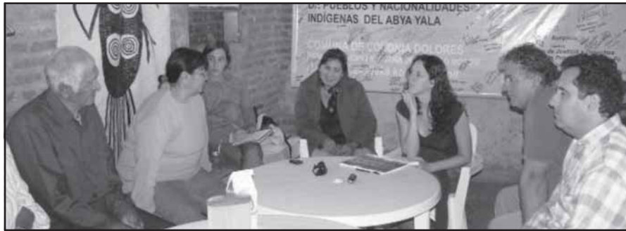
Talleres realizados en abril de 2010 - Grupo de adultos y concejo de ancianos.