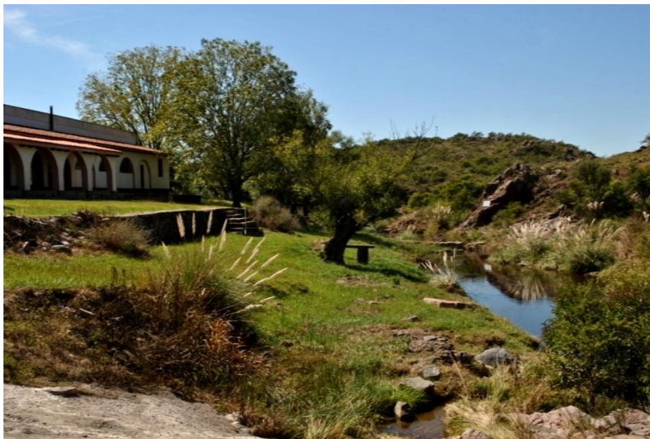
Figura 8. Arroyo que atraviesa el Seminario Jesús Buen Pastor - Las Peñas.