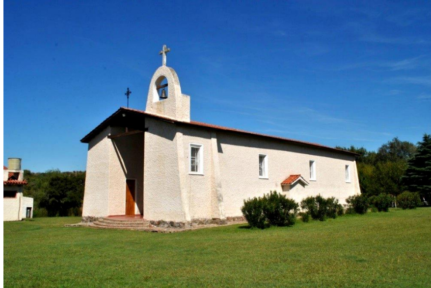
Figura 7. Capilla del Seminario Jesús Buen Pastor - Las Peñas.