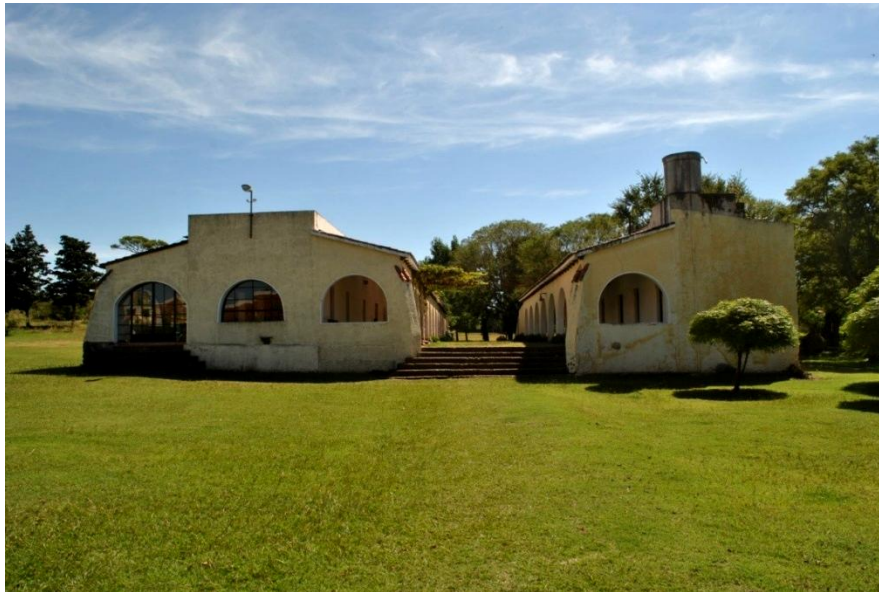
Figura 9. El Seminario Jesús Buen Pastor - Las Peñas.

Al hacer un recorrido histórico, se observa que esta área patrimonial se encuentra enmarcada dentro de un proceso de afianzamiento del poder español en las tierras del sur de Córdoba y su acción evangelizadora. Por lo que, estos bienes patrimonializables poseen no solo su valor amplio indiscutible de la historia y la fe que llevan plasmada desde hace 300 años. Si no que también se suman su valor referente a su arquitectura, marcada por las técnicas y materiales que aún siguen en pie, allí en la espera de que los diseños