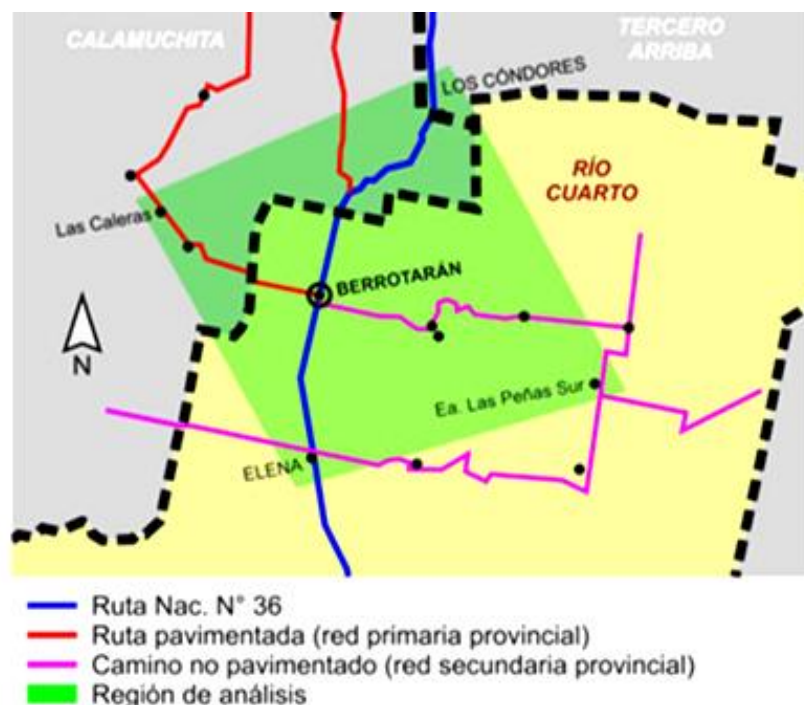
Figura 1: Anteproyecto complejo regional industrial, comercial y de servicios Berrotarán - Provincia de Córdoba. 2017.

potencial corredor turístico (eje este-oeste). Transformándose así en el "Portal de las Sierras" y constituyéndose en fachada de la localidad, ya que es uno de los trayectos asfaltados hacia el centro-sur serrano. (Extraído de Anteproyecto complejo regional industrial, comercial y de servicios Berrotarán - Provincia de Córdoba. 2017).