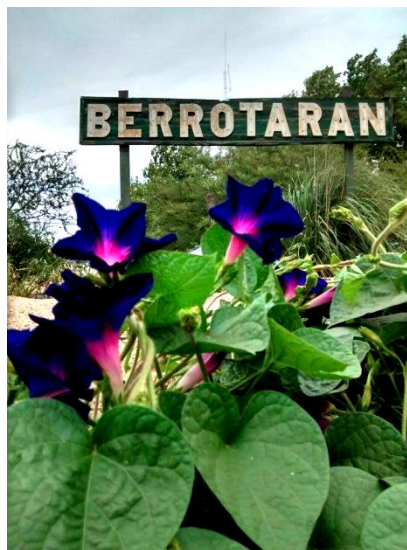
Figura 4: Museo del Centenario de Berrotarán. Fotografía propia. 2019..

De esta manera se vio reflejada la situación de impacto educativo a favor de la revalorización y conservación del patrimonio integral local y resguardo de la memoria colectiva, lo que permitió evaluar su importancia, integralidad y patrimonialidad a nivel provincial, local y regional. Todo ello con el objetivo de dar continuidad a la ampliación de su propuesta museológica y museográfica bajo los cánones que implican un museo vivo, un museo abierto y sostenible. (Vilches, 2020).