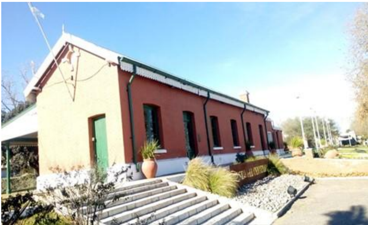
Figura 3: Museo del Centenario de Berrotarán. 2019.

fesora Yanina Aguilar, se presentaron en la convocatoria “Ricardo Roig” sobre proyectos de estímulo a la vocación emprendedora (UNRC), el proyecto denominado “Puesta en valor y proyección turística del museo del Centenario de la localidad de Berrotarán en el marco del corredor cultural Camino de Arrias del sur de Córdoba 2017/2018.