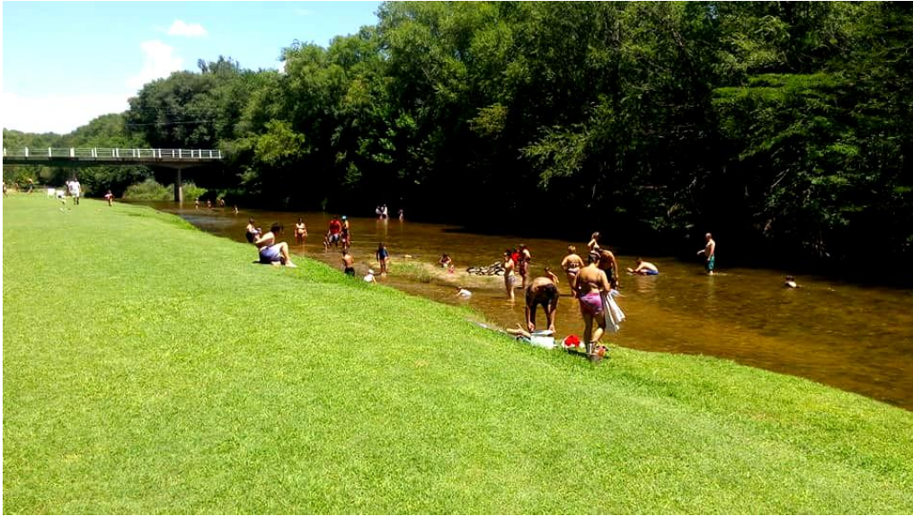
Figura 2: Río Paso Cabral. 2019.