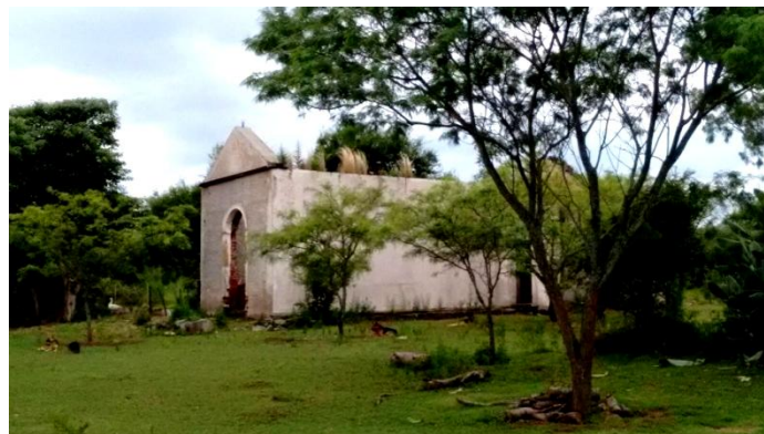
Figura 6. Capilla de la Estancia "El Potociorco". Fotografía propia .2017