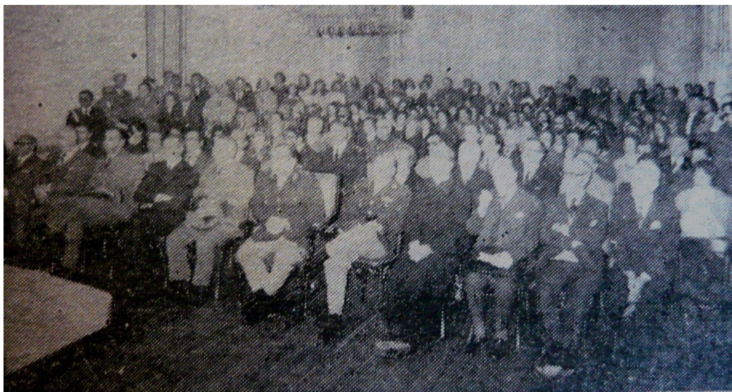
Imagen 5. Reunión de Juntas Provinciales de Historia. Conferencia en el Salón Blanco Municipal, Río Cuarto, 20/08/76.