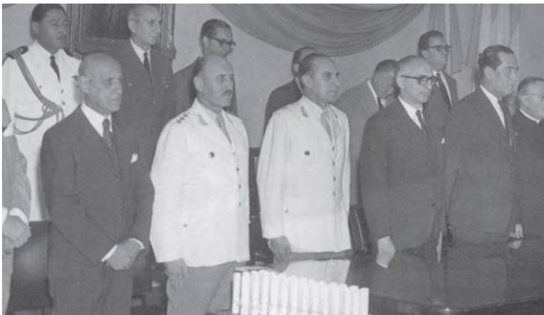
Imagen 1. El Gral. Picca en el acto de clausura del VII Curso de Defensa Nacional, Escuela Nacional de Guerra, 19/12/60.

Fuente: Chiarini y Portugheis (2014, p. 223). En la foto se encuentra el presidente de la Nación Dr. Arturo Frondizi