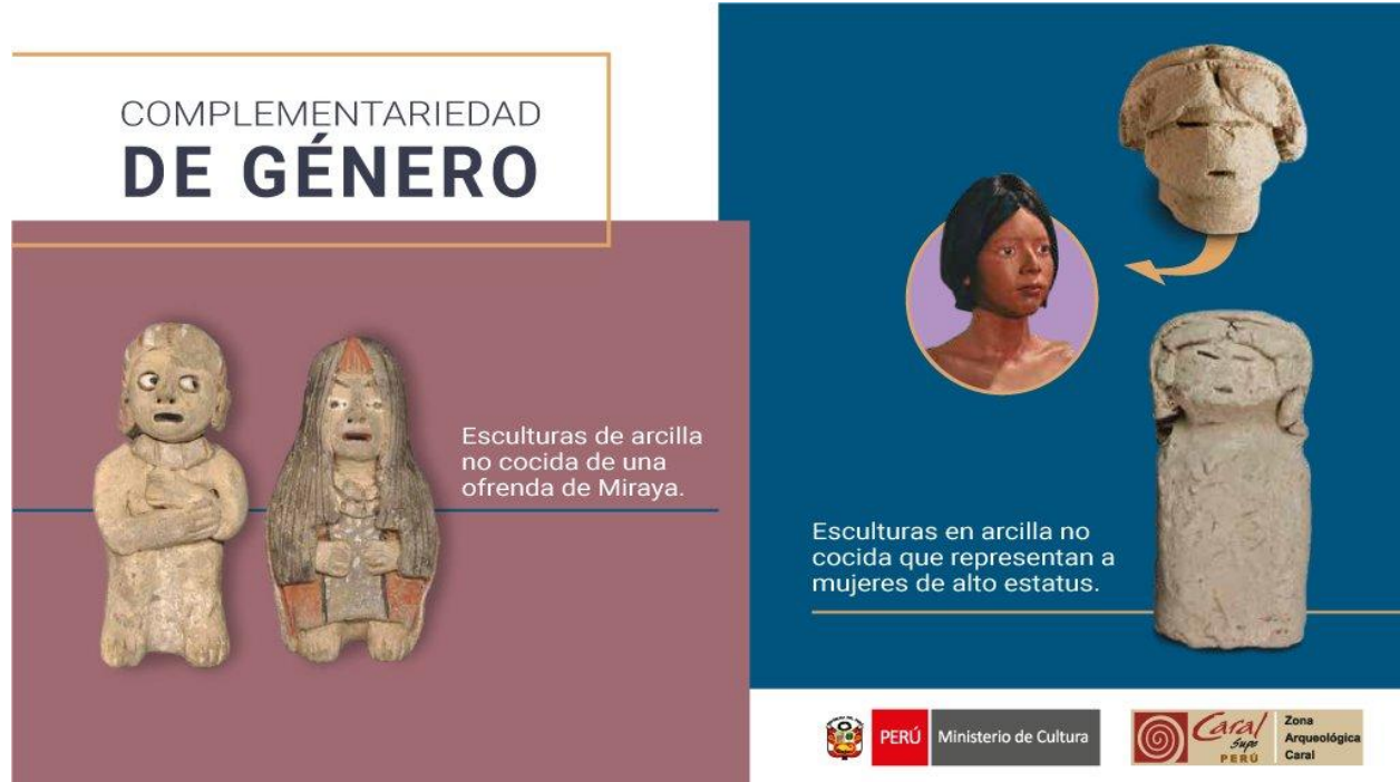
Figura 3. Flyer ilustrativo sobre Complementariedad de Género en Cultura Caral.

tisa de Chornancap ; Mama Wako , como fundadora posible del Imperio inca; la Coya , como reina hija de la Luna; las Señoras ñaca , Ñustas , Pallas ; las Acllas , tejedoras del Imperio y las divinidades de la Pacha Mama en tanto la tierra, madre universal y la luna en carácter de género mujer en tanto complemento del sol.