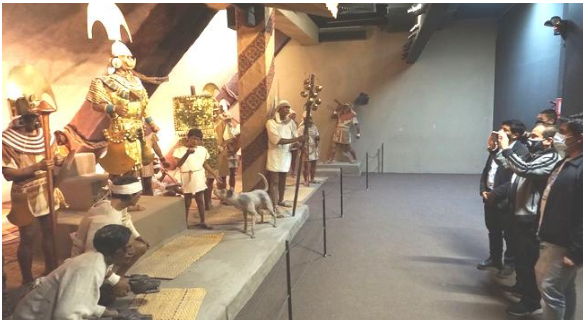
Figura 6. Reconstrucción del Señor de Sipán en Museo Tumbas Reales de Sipán.