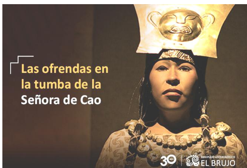
Figura 4. Infografía sobre La Señora de Cao.

Incluso si queremos superponer ambas historias, pertenecientes al mismo universo cultural, pero de cronologías y espacialidades diferenciadas 3 (Valle de Moche y Lambayeque) hay quienes sostienen que “desde el Señor de Sipán, por ejemplo, entre él y el viejo Señor de Sipán había una estirpe matrilineal, el poder lo daba la mujer (Villavicencio 2022)”.