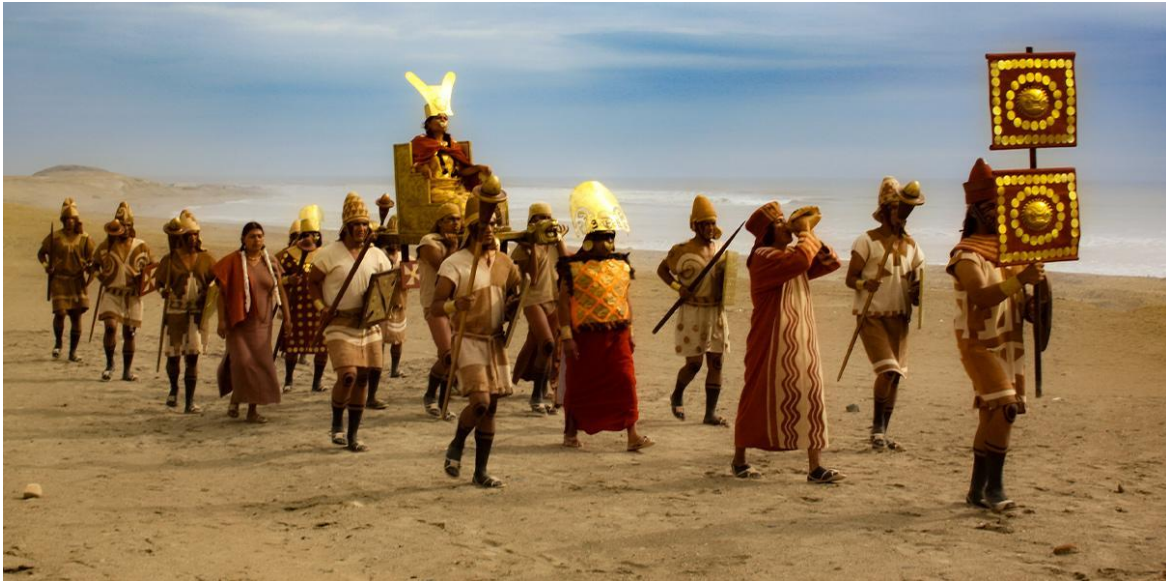
Figura 5. Reconstrucción escenográfica en base a las interpretaciones arqueológicas.