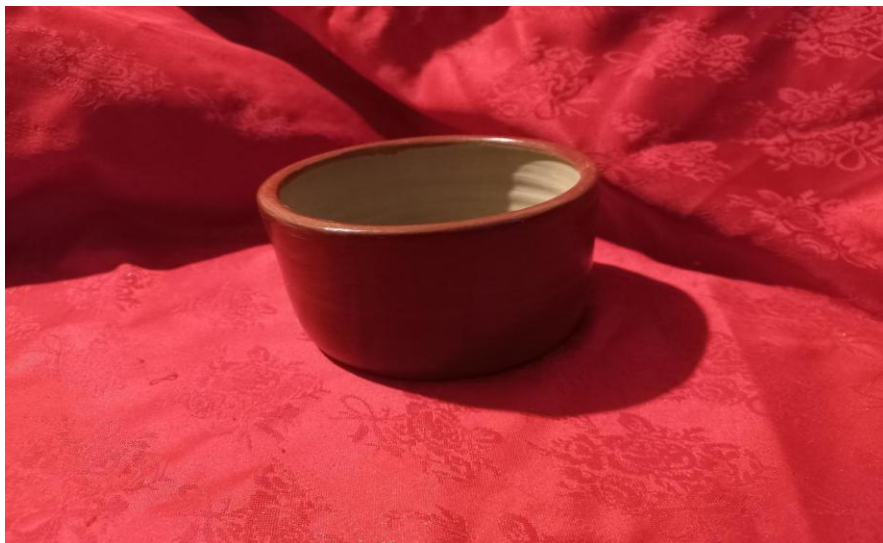
Figura 4. Cuenco obtenido mediante torno, pintado y con aplicación de brillo de copal. Julio Ricopa. Padrecocha.