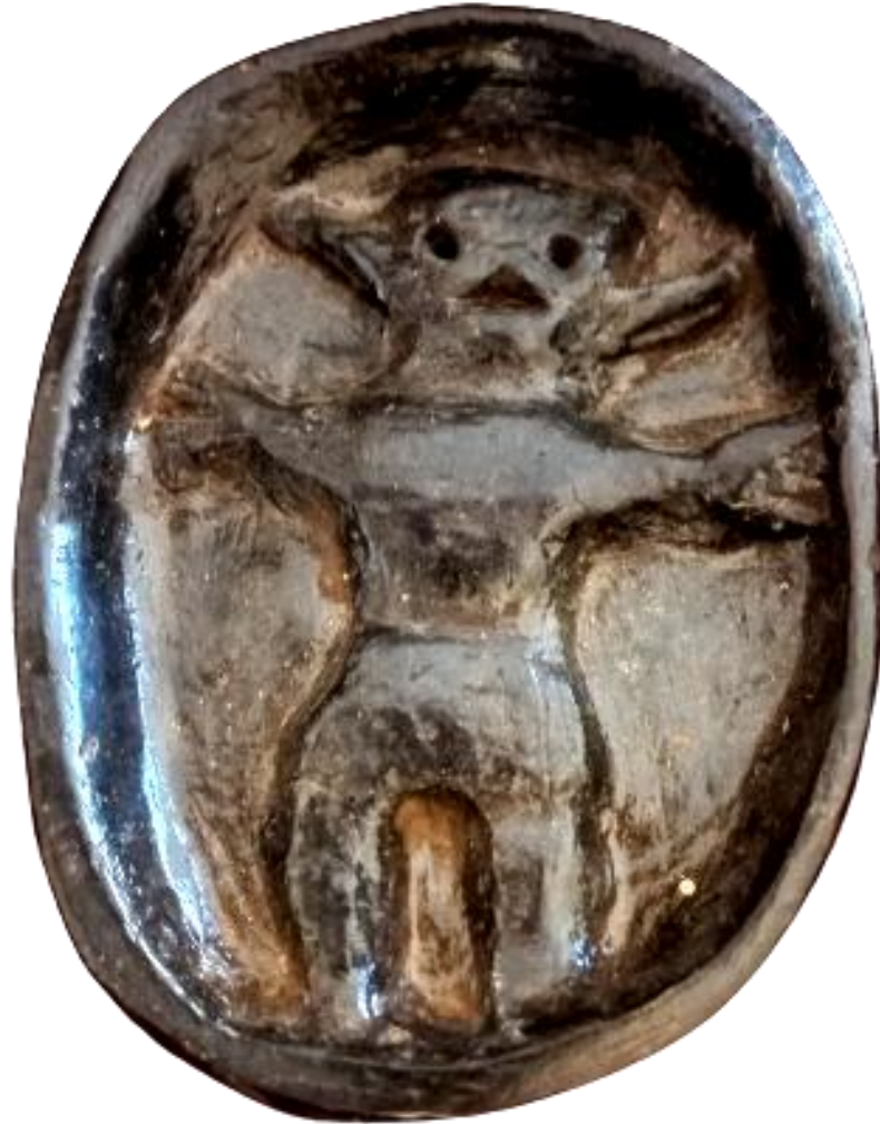
Figura 15. Placa en altorrelieve. “Diablito” Alejandro Canayo Aricuara. Santo Tomás

y excavadas dejando en su interior una figura en bajorrelieve que el autor denomina “diablito” y que puede tratarse del shapshico o chullaychaqui, un espíritu cojo que se lleva gente en la selva (Rocchietti 2021; Rocchietti y Cárdenas Grefa, 2022) (Figuras 15, 16, y 17).