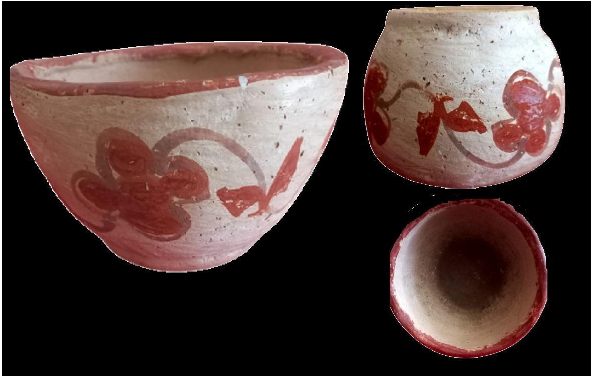
Figura 3. Cuenco con decoración floral. Vista lateral, base y boca. Julio Ricopa. Padrecocha.