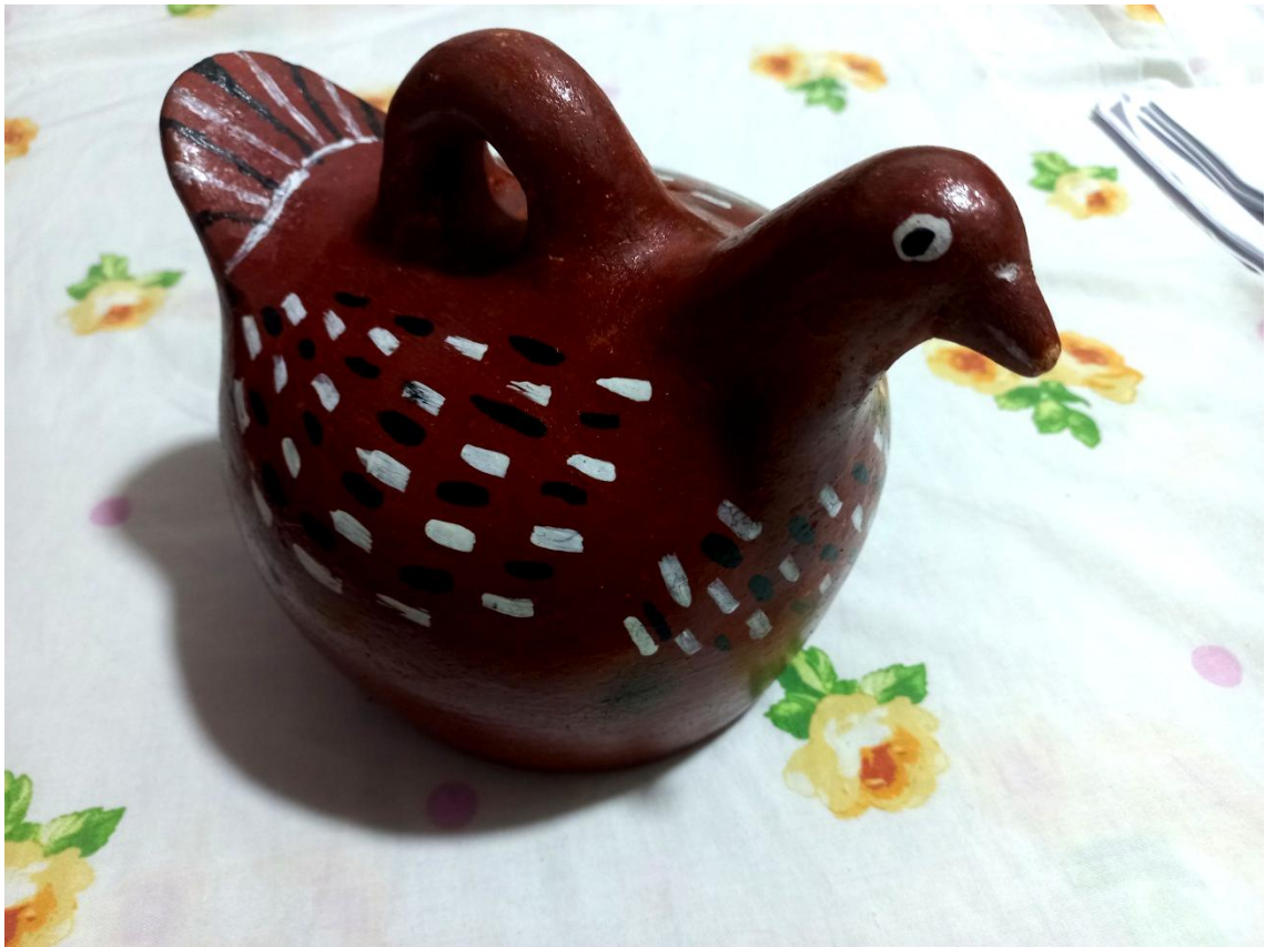
Figura 8. Ave. Paloma de monte (torcaza, Zenaida auriculata ). María Mamayama. Belén (ambulante). Original de Padrecocha.