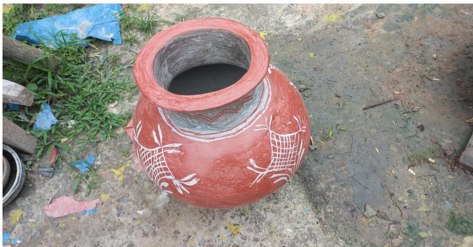
Figura 2. Cántaro pintado blanco sobre rojo. Alejandro Canayo Aricara. Santo Tomás.

borde evertido, cuello y cuerpo hemisférico sobre base plana (Figuras 2 y 3), o de que hayan usado molde o torno. En este caso, todas las piezas tienen igual forma (generalmente cilíndrica o esférica) diferenciándose en el terminado (engobe, aplicación de copal o Protium copal ) o en la decoración pintada (Figura 4). En este conjunto las transformaciones y adaptaciones “modernas” son muchas. En algunas ya no se reconoce la tradición Kukama. Es la demanda del mercado.