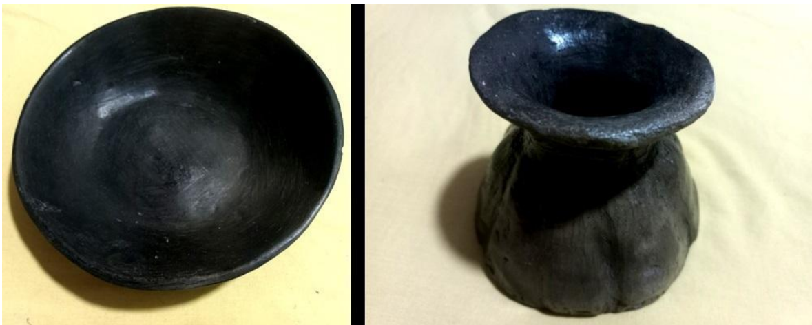
Figura 6. Plato y jarra. Lidia Canayo Aricuara. Santo Tomás.

En cambio, el plato que ilustra la figura 6 se realizó modelando un disco de de arcilla y aplastándolo hasta darle forma circular con base apenas diferenciada del arco y la jarra mediante rollos complementados con una aplicación de material amasado como disco para darle una aguda forma evertida.