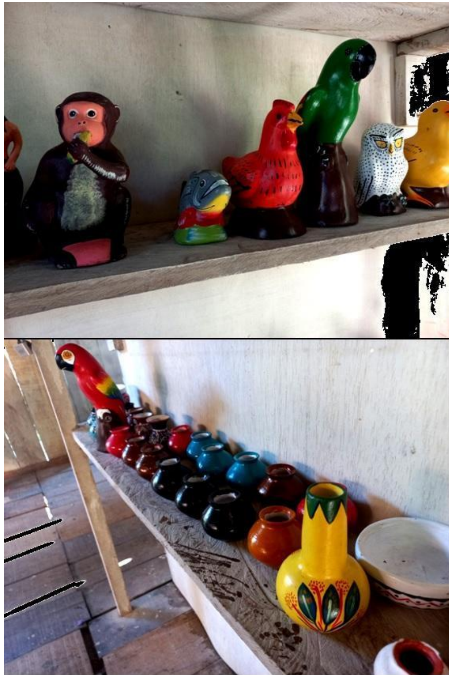
Figura 9. Repertorio de animales. Yolanda Leiche Ricopa. Padrecocha.