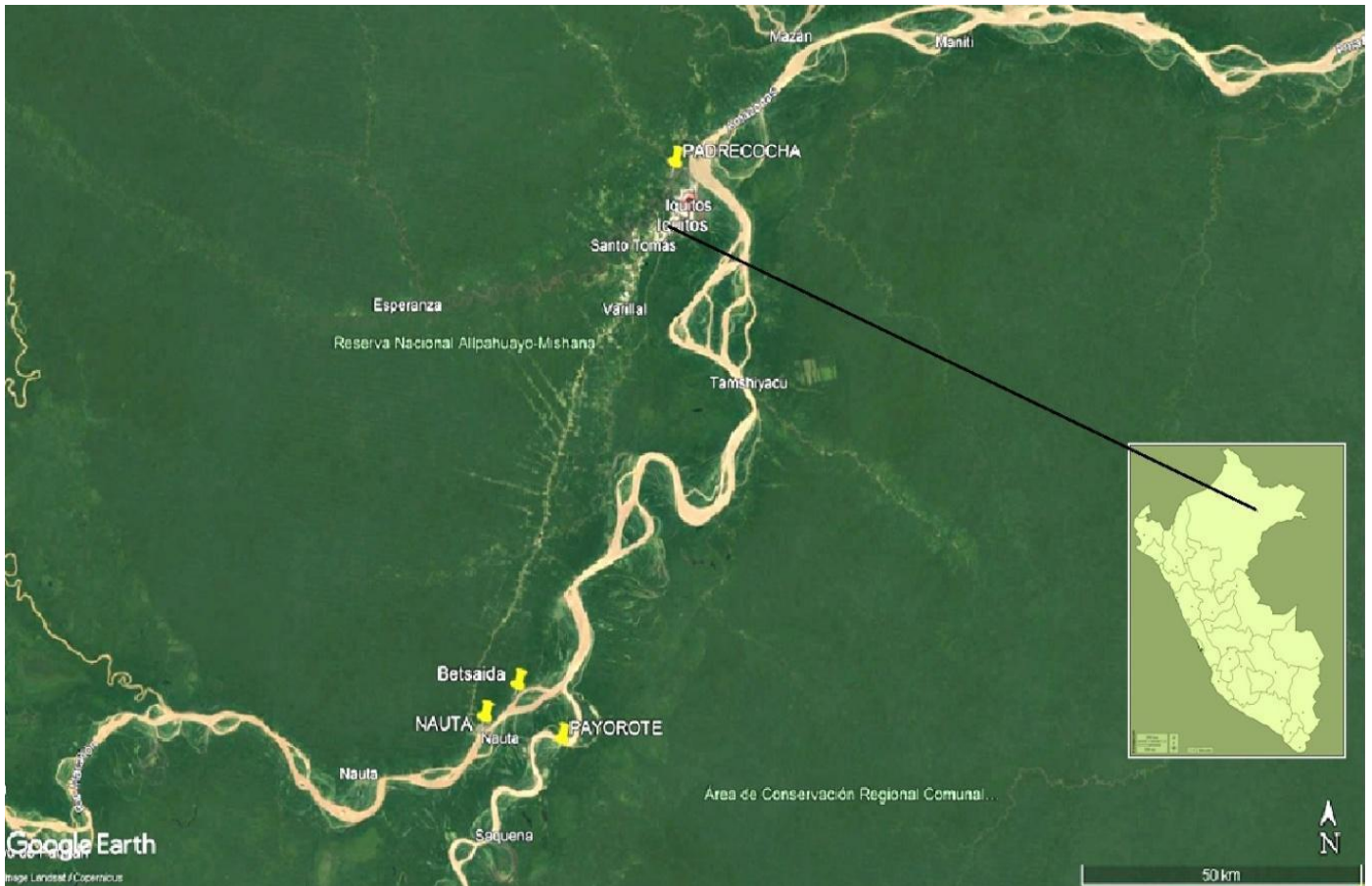
Figura 1. Ubicación del área estudiada.

En este caso, la colección de obras proviene de los alfares de tres familias localizadas respectivamente, dos en Padrecocha (Ahuanari y Ricopa) y una en Santo Tomás (Canayo Aricara). Son conglome-