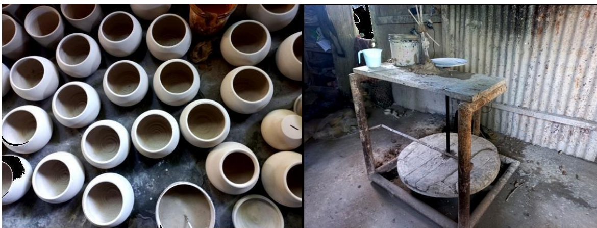
Figura 7. Cerámicas fabricadas con torno. Julio Ricopa. Padrecocha.

La incorporación de los tornos ha permitido la estandarización de los contenidos con mayor rendimiento económico en el mercado (Figura 7).