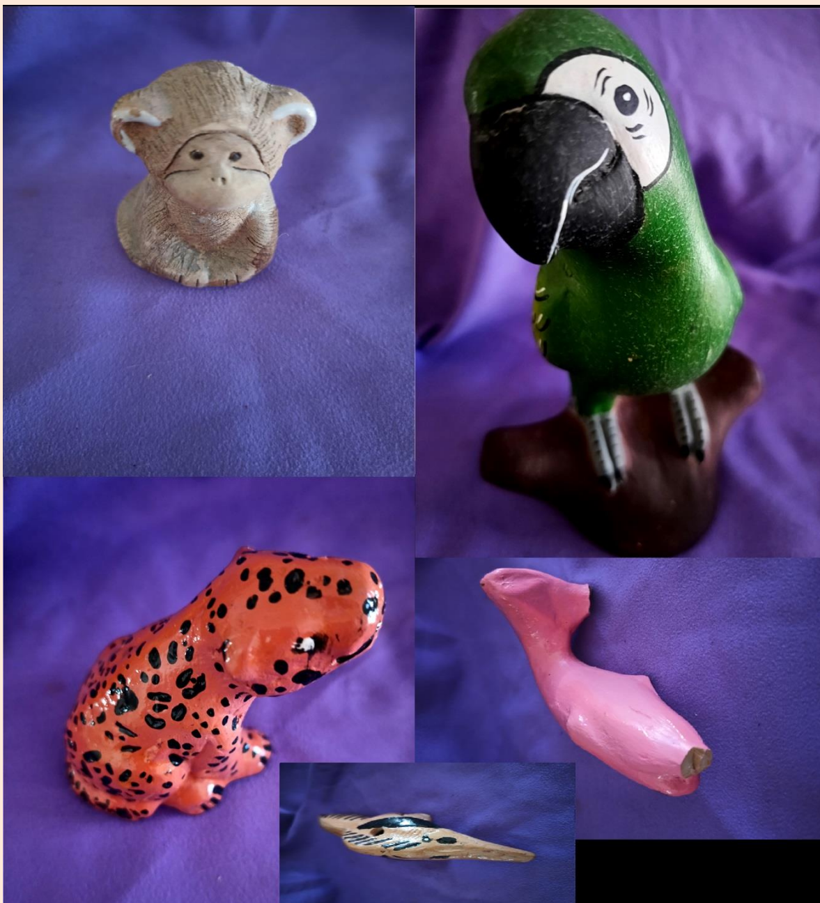
Figura 5. Ceramios Kukama Kukamiria. Animales-alcancías. Anónimos. Col. AMR.