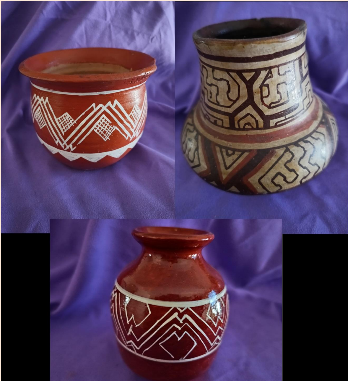
Figura 4. Ceramios Kukama Kukamiria. Contenedores. Anónimos. Col. AMR.