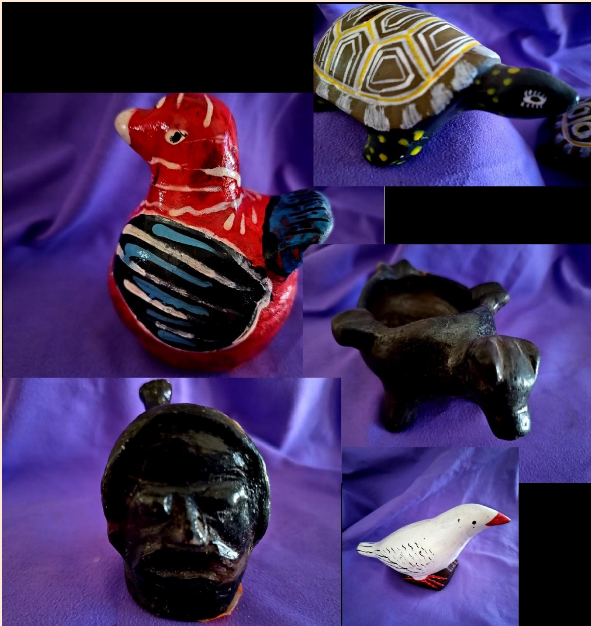
Figura 6. Ceramios Kukama Kukamiria. Animales y Chullachaqui (rostro). Anónimos. Col. AMR.