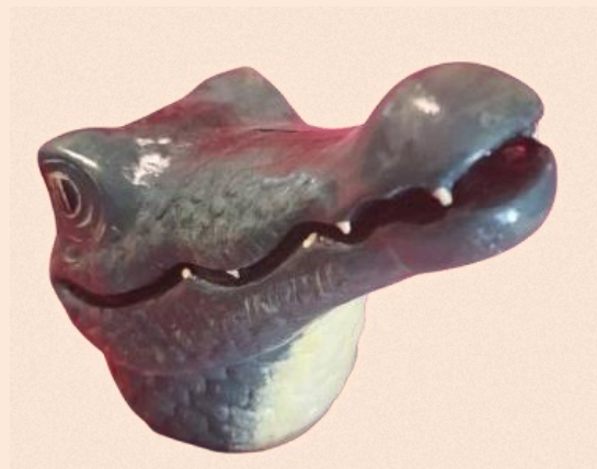
Figura 3. Caimán cerámico. Variaciones naturales: caimán blanco (Caimán cocodrilus), caimán negro (melanosuchus niger), yacaré (Caimán yacaré). Anónimo. Col. AMR.