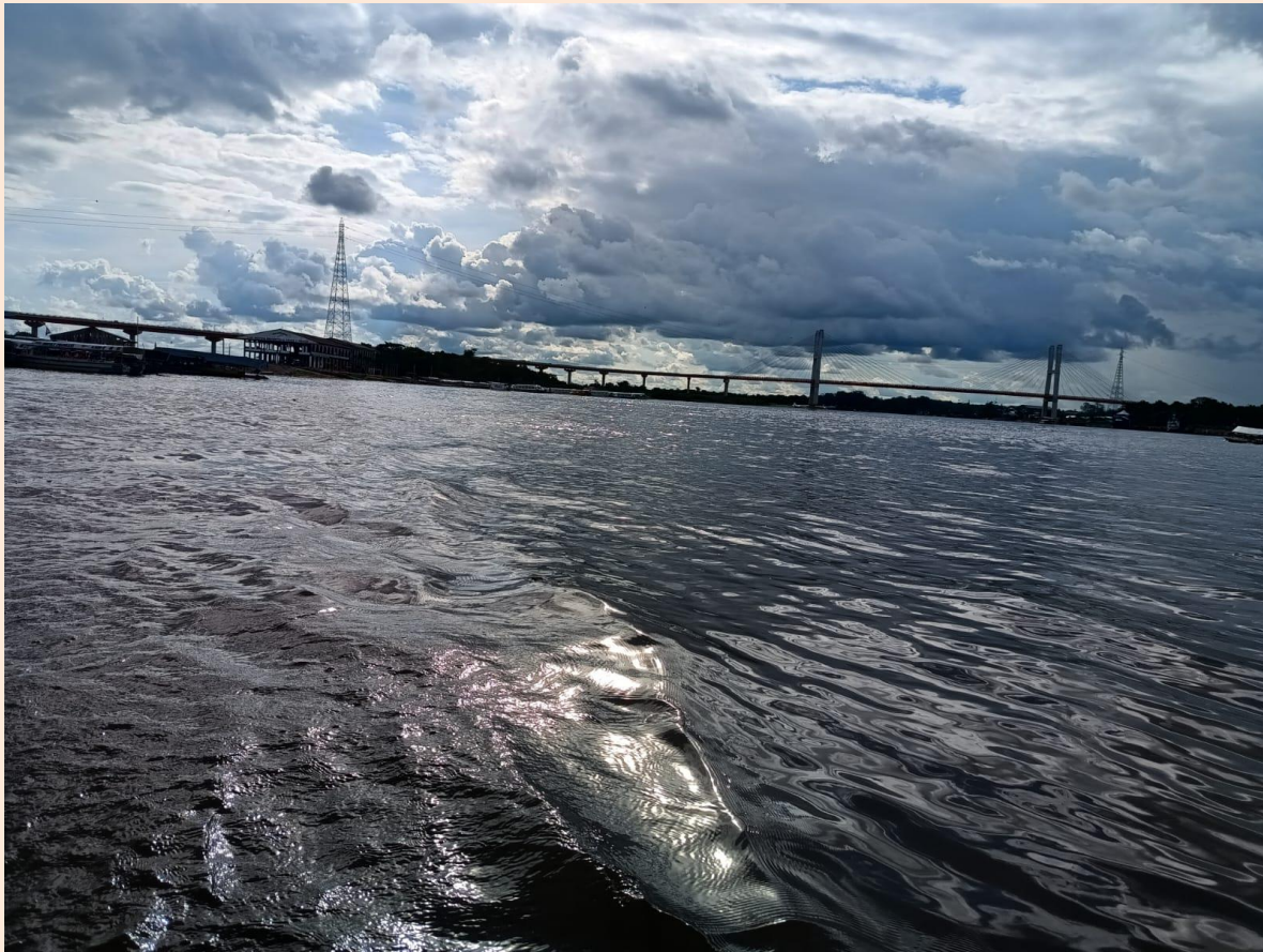
Figura 2. Río Nanay a la altura del puente carretero.