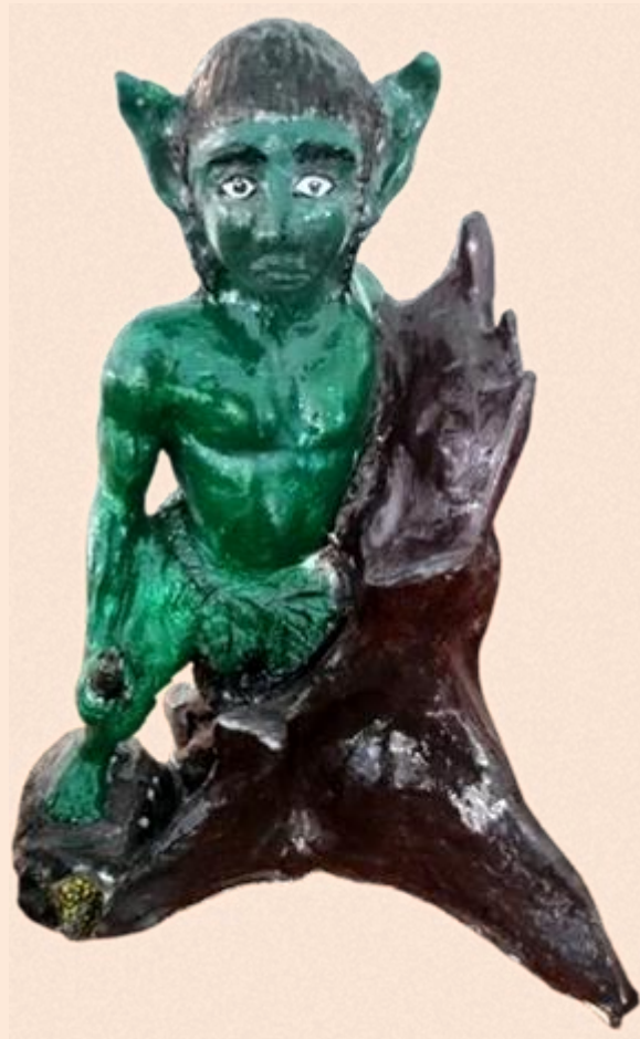
Chullachaqui cerámico Kukama Kukamiria. Col. Sindicato Único de Trabajadores de la Universidad Nacional de la Amazonía Peruana (SUTUNAP).