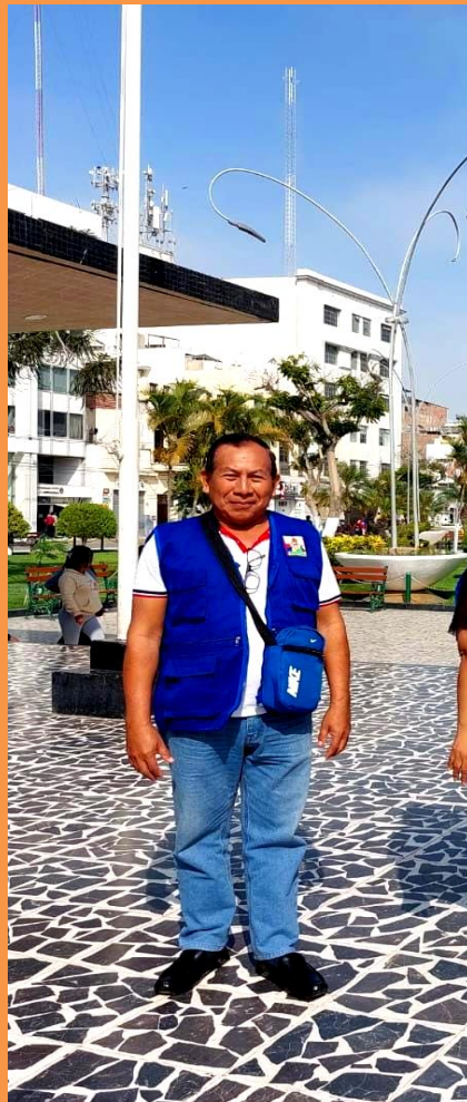
Fotografía Augusto Cárdenas Greffa