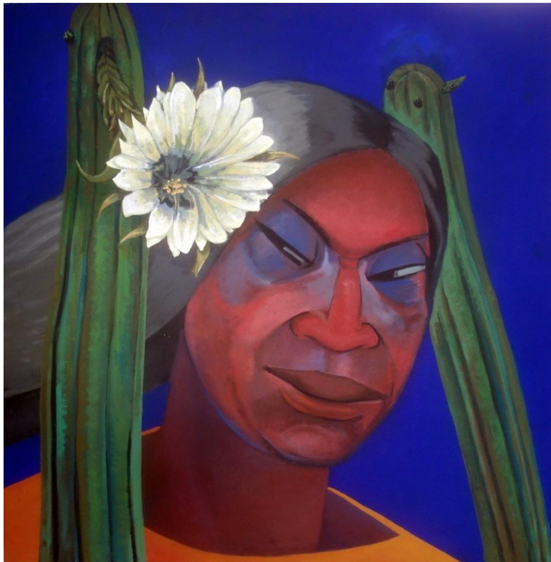
Figura 13. Cactus “San Pedro” florecido (óleo de Héctor Suárez García)

Debo subrayar la información que ellos brindaron sobre la conformación de la “mesa” o altar ritual, cuyos elementos son imprescindibles para curar y sacar los males desconocidos; de modo que -por ejemplo-, si una mesa careciera del cactus “San Pedro” (Figura 13), no sería posible el ritual, por cuanto gracias a este el curandero logra que el paciente transmita la enfermedad que lo aqueja (Silva, Op. Cit. , pp. 24-25).