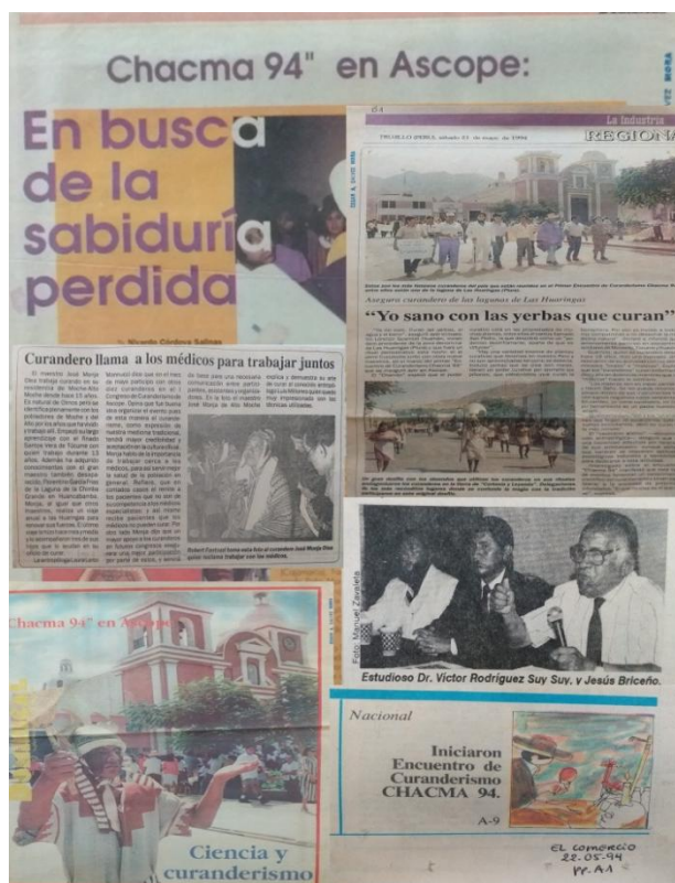
Figura 14. Divulgación del evento por los medios de comunicación de Trujillo y Lima.

ros a partir de entrevistas, muchas de las cuales, al ser transcritas textualmente, son material importante para los investigadores (Figura 14). La prensa brindó el espacio necesario para artículos de opinión, escritos por académicos participantes (Fofero y Zevallos, 1994; Hampe, 1994, entre otros).