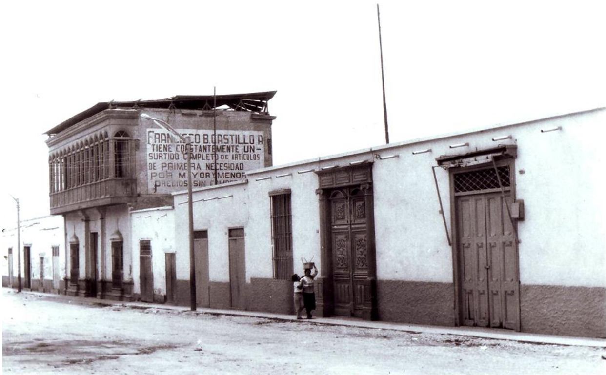
Figura 6. Calle principal de la ciudad de Ascope, sede del Primer Encuentro de Curanderismo Chacma 94.

En el presente artículo presentaré la información vinculada al Primer Encuentro de Curanderismo Chacma 94, destacando su importancia y aporte en favor de un mayor conocimiento de esta práctica ancestral, y la aproximación de la academia hacia un conocimiento cuya vigencia es significativa en la vida y memoria de los pueblos tradicionales del norte del Perú y, en particular del departamento de la Libertad.