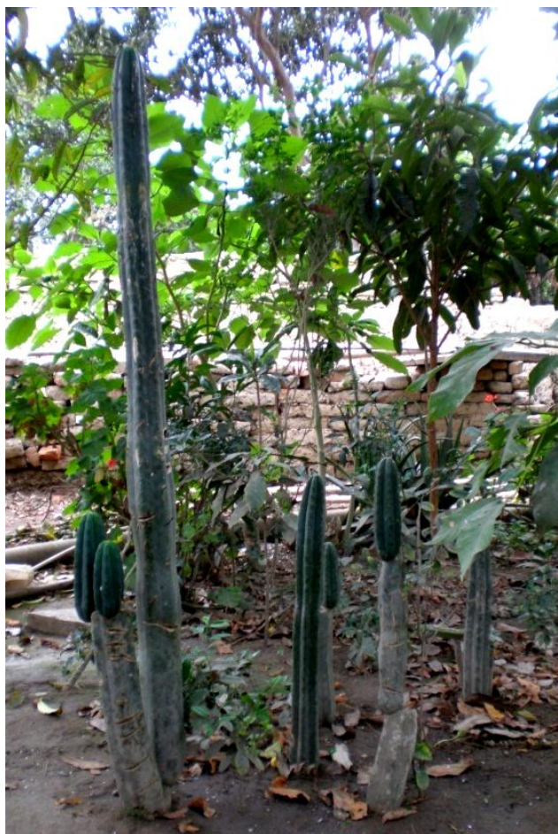
Figura 3. “San Pedro”, en un jardín de la villa de Magdalena de Cao

Antes de la década de 1990, la relación entre curanderos y académicos en el territorio mencionado se estableció en el marco de investigaciones realizadas por científicos peruanos y extranjeros (Calderón y Sharon 1978; Gillin 1947; Glass-Coffin, 2009; Miranda, 2009; Molina 1984; Polia 1990; Rodríguez, 1975, Op. Cit. ; Sharon, 1978, 2009; Vásquez, 2009). En contadas ocasiones los curanderos fueron coautores de publicaciones (Cal-