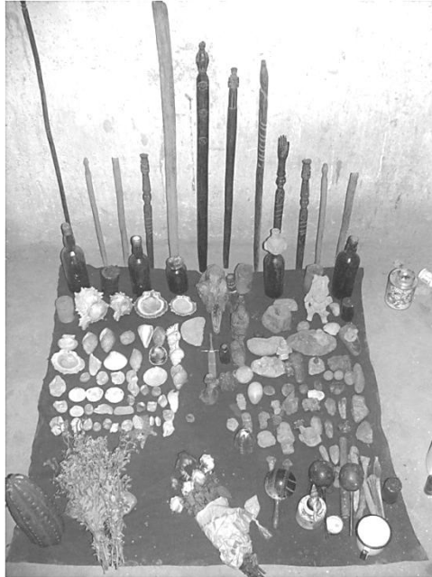
Figura 9. “Mesa” del maestro curandero Leoncio Carrión (Omballec) (†): objetos (“artes”) y varas. De izquierda a derecha, los campos: ganadero (Izq.), centro, y justiciero (derecha) (Foto: Omar Fonseca).

Los trabajos consistieron en “mesadas” o rituales a cargo de los maestros curanderos ante su altar ritual, llamado “mesa” 7 (Figura 9), durante la noche del viernes 20 y antes de la salida del sol del sábado 21 de mayo.