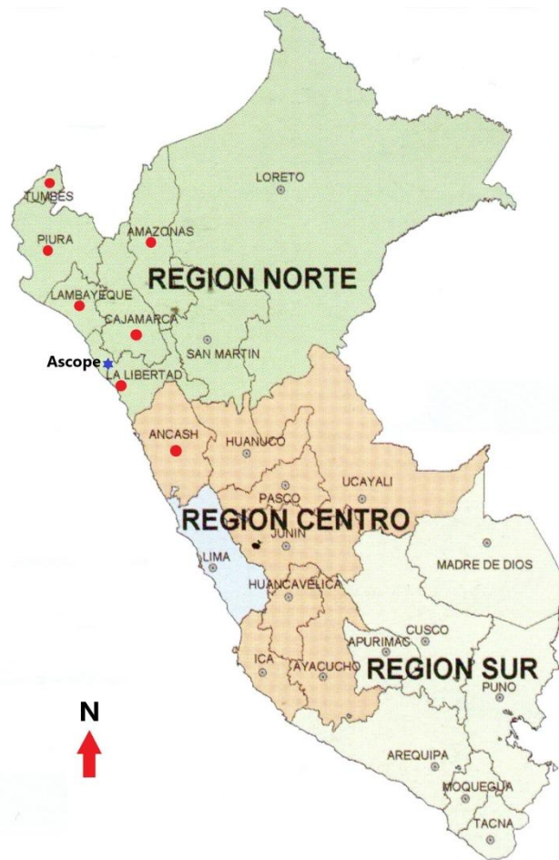
Figura1. La macro región norte de Perú. Los puntos rojos indican los departamentos donde se usa el cactus San Pedro en los rituales del curanderismo.

Además, “El curandero..., es la persona (hombre o mujer), que recupera el estado normal de la persona, animal o cosa afectados por su desmejoramiento. Es la persona que cura las enfermedades más temidas o peligrosas” (Rodríguez, 1975, p. 164), y como “...respuesta a esos dos