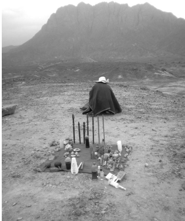
Figura 10. Curandero ante el Cerro Cuculicote, montaña tutelar del valle de Chicama

entre otros), donde curanderos de Ascope y alrededores realizan sus rituales e invocan a los “encantos” de esta montaña (Gálvez, 2009, 2014a, 2014b; Gálvez, Castañeda, Espinoza y Runcio, 2012) (Figura 10).