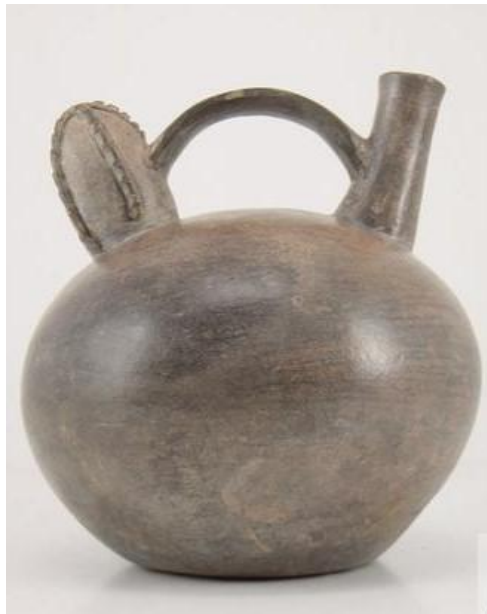
Figura 2. Representación del cactus San Pedro en una botella Cupisnique (ca. 3, 500 a.P.). (Museo Larco).

rituales de curanderismo (Silva, 2009, pp. 24-25) (Figuras 2, 3).