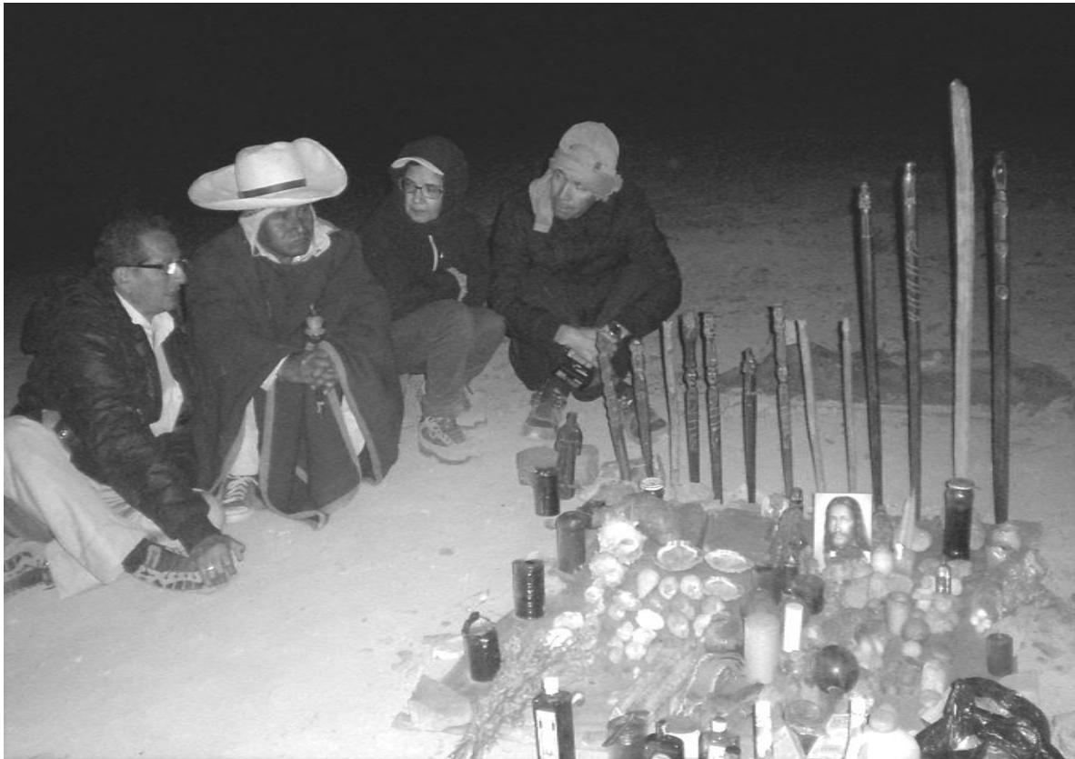
Figura 11. “Mesada” o ritual al anochecer del viernes 20 de mayo de 1994.

A las 21:30 horas los maestros curanderos instalaron sus “mesas”, explicando a los participantes las características de éstas y la labor del curandero; finalmente, desde las 22:30 horas empezaron los rituales o “mesadas” (Figura 11).