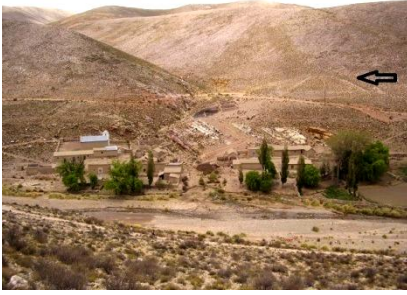
Figura 4. Cuadro de cultivo trapezoidal frente al actual poblado de La Cueva, donde se localizó la Posta de La Cueva (ANT-C), en el Sector Medio de la quebrada.

La segunda sub-área, es decir los alrededores del sitio HUM.08, presenta campos de cultivo como los anteriormente descritos para los sectores Inferior y Medio, a los que se suman terrazas de cultivo frente al sitio HUM.08 y algunas acequias. Más hacia el norte, en quebradas muy encajonadas de la margin Este del río La Cueva, se encuentran grandes “canchones” arqueológicos y actuales junto a vegas de altura (Figura 5).