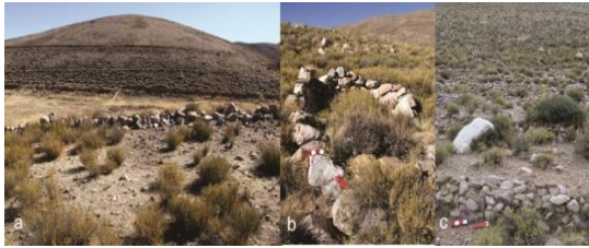
Figura 2. a) Cuadros de cultivo en el Sector Inferior de la quebrada de La Cueva; b) Estructura circular o refugio adosado a campo de cultivo en el Sector Inferior de la quebrada de La Cueva; c) Pequeñas terrazas frente a HUM.05, en el Sector Inferior de la quebrada de La Cueva.

B) “Canchones” 3 de cultivo en faldeos de pendiente suave a pronunciada, con forma rectangular, elaborados con piedras acomodadas -con y sin mortero-, paredes de más de 60 m de longitud, con muros de hasta 1,70 m de ancho y 1,40 m de altura -ambos valores conservados- (que incluye al menos en el último caso, hasta cinco hileras de piedras). Los “canchones” presentan líquenes con abundancia media, pero no todos poseen material cultural en superficie. Uno de ellos presenta un surco, posiblemente para canalizar el agua, mientras otros ejemplos muestran despedres o ronques en su interior.