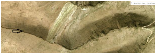
Figura 3. “Canchones” de grandes dimensiones en la margen Oeste del río La Cueva, en el Sector Inferior de la quebrada. Imagen extraída de Bing Maps (2020).

terreno porque originalmente no se detectaron mediante el análisis de las imágenes satelitales obtenidas de Google Earth y Bing Maps.