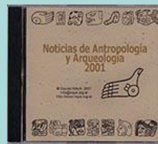
NAYa en CDROM