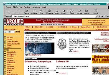
NAYa en INTERNET

http://www.naya.org.ar http://www.antropologia.com.ar http://www.arqueologia.com.ar