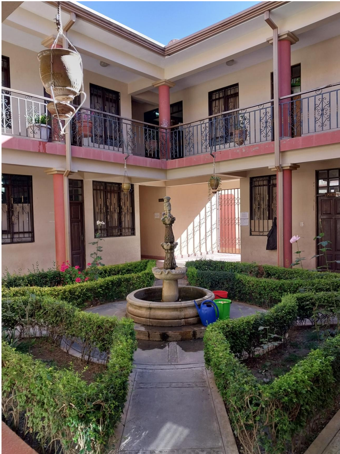
Figura 4: Alcaldía.