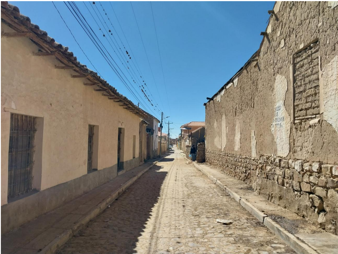
Figura 15. Calles de Tarabuco.