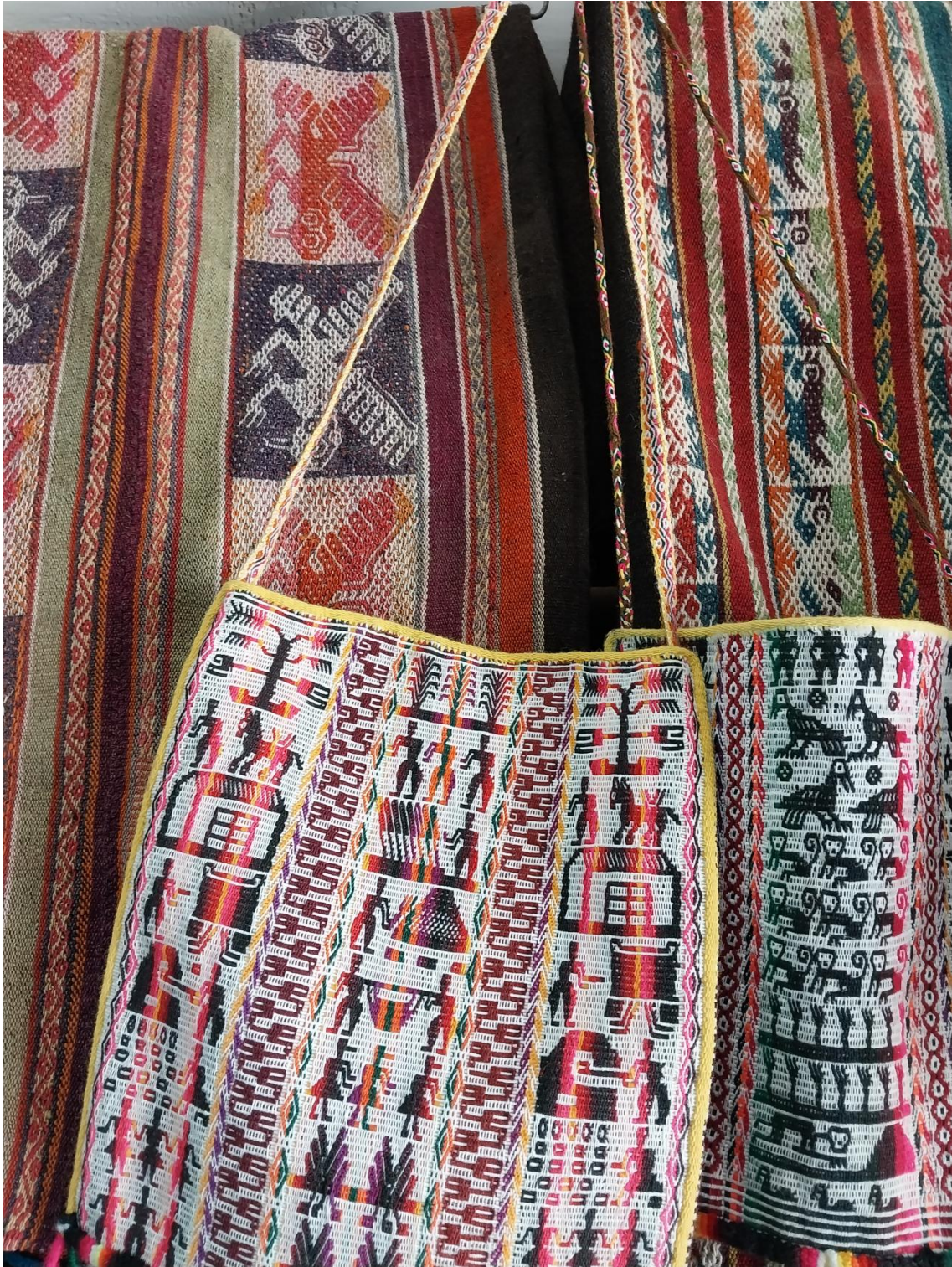
Figura 7: Arte textil.