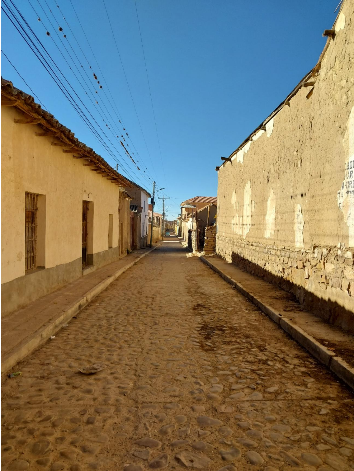
Figura 11, Calles de Tarabuco.