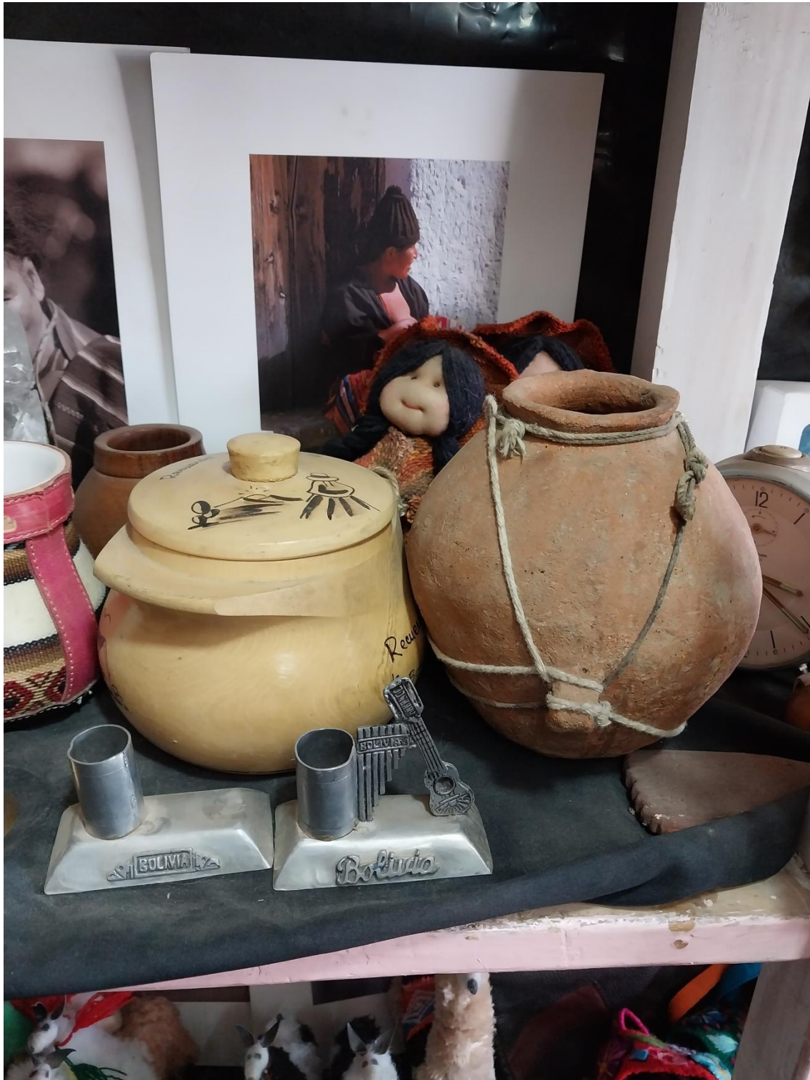
Figura 10: Cerámica.