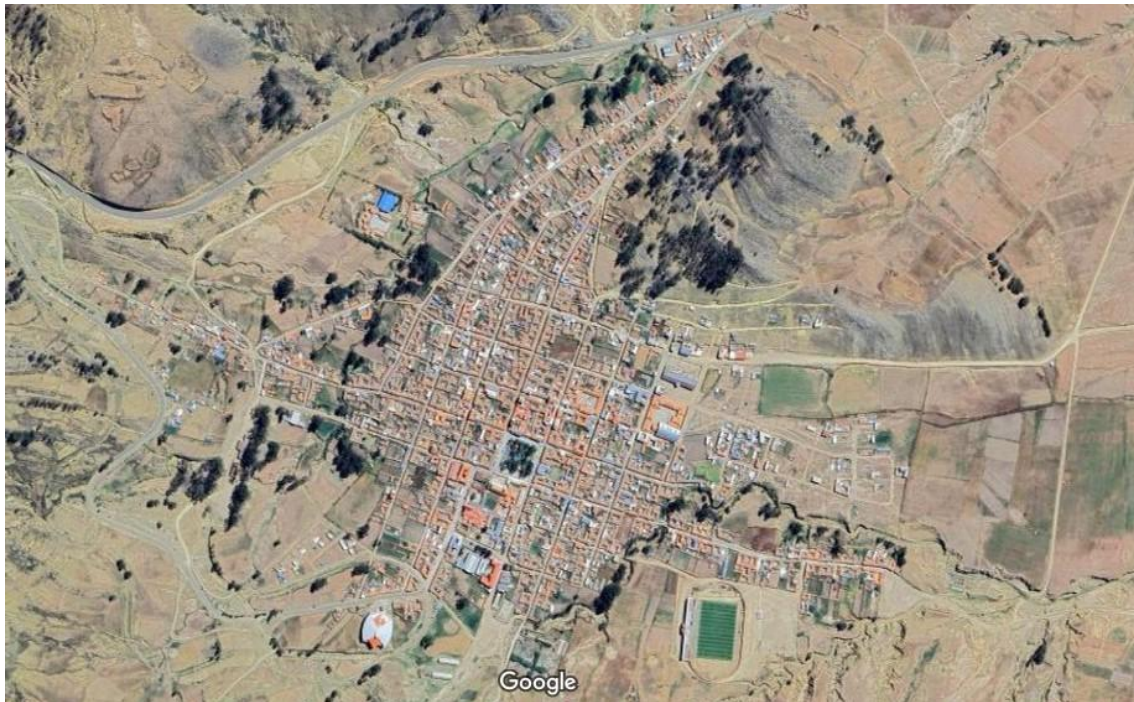
Figura 1: Imagen satelital.