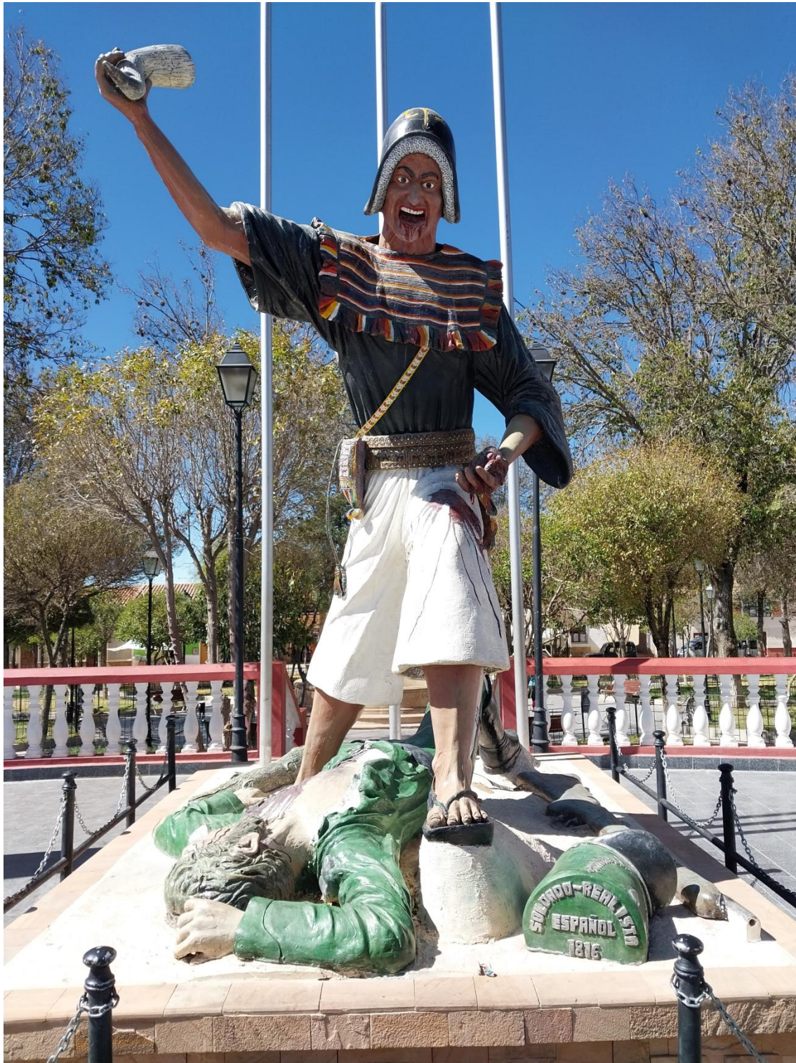
Figura 5: Monumento a la Batalla de Jumbate.