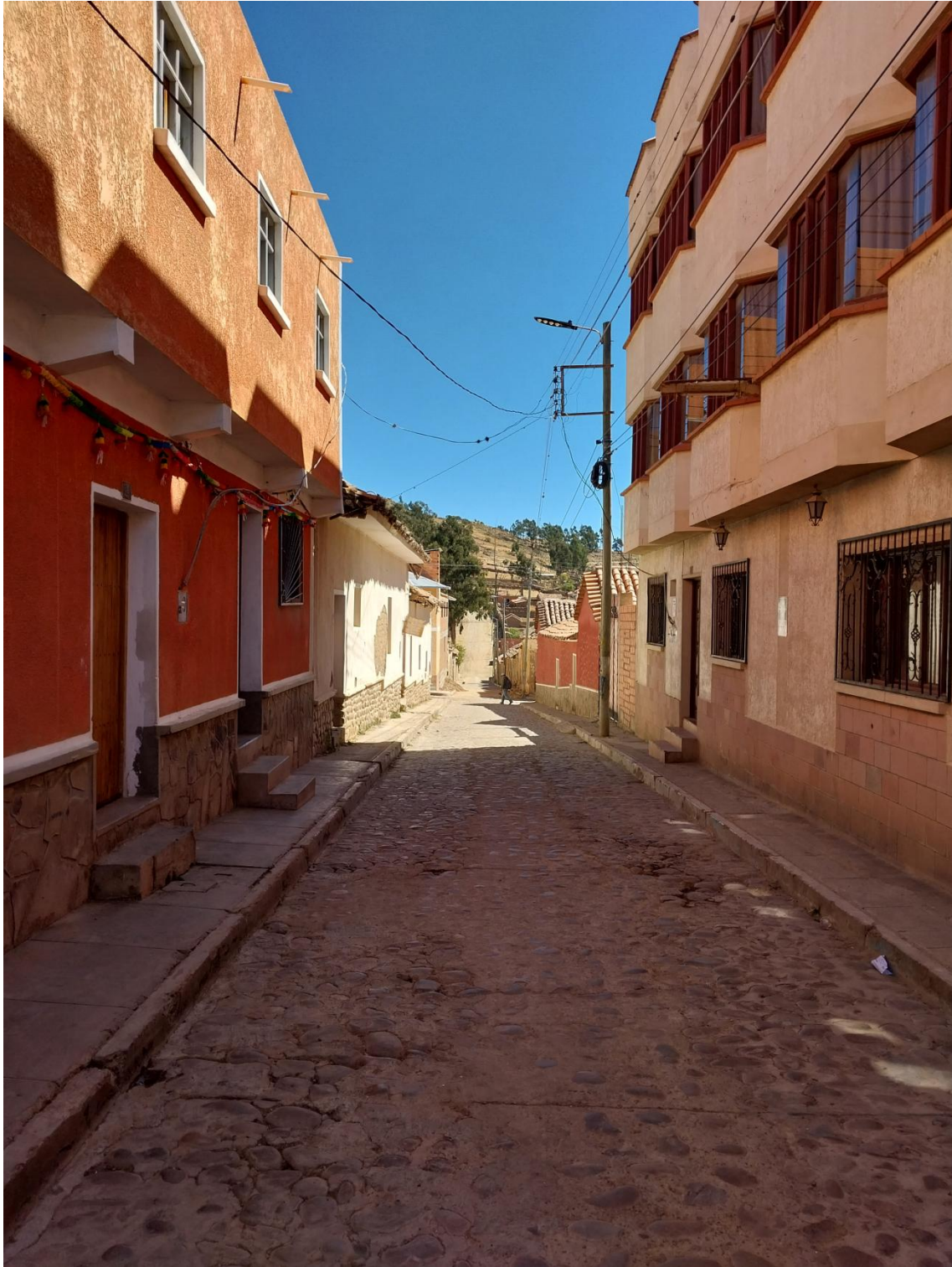
Figura 14. Calles de Tarabuco.