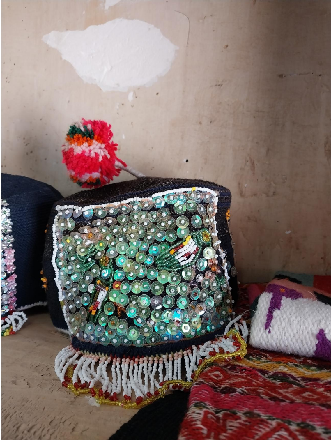
Figura 8: Arte textil.