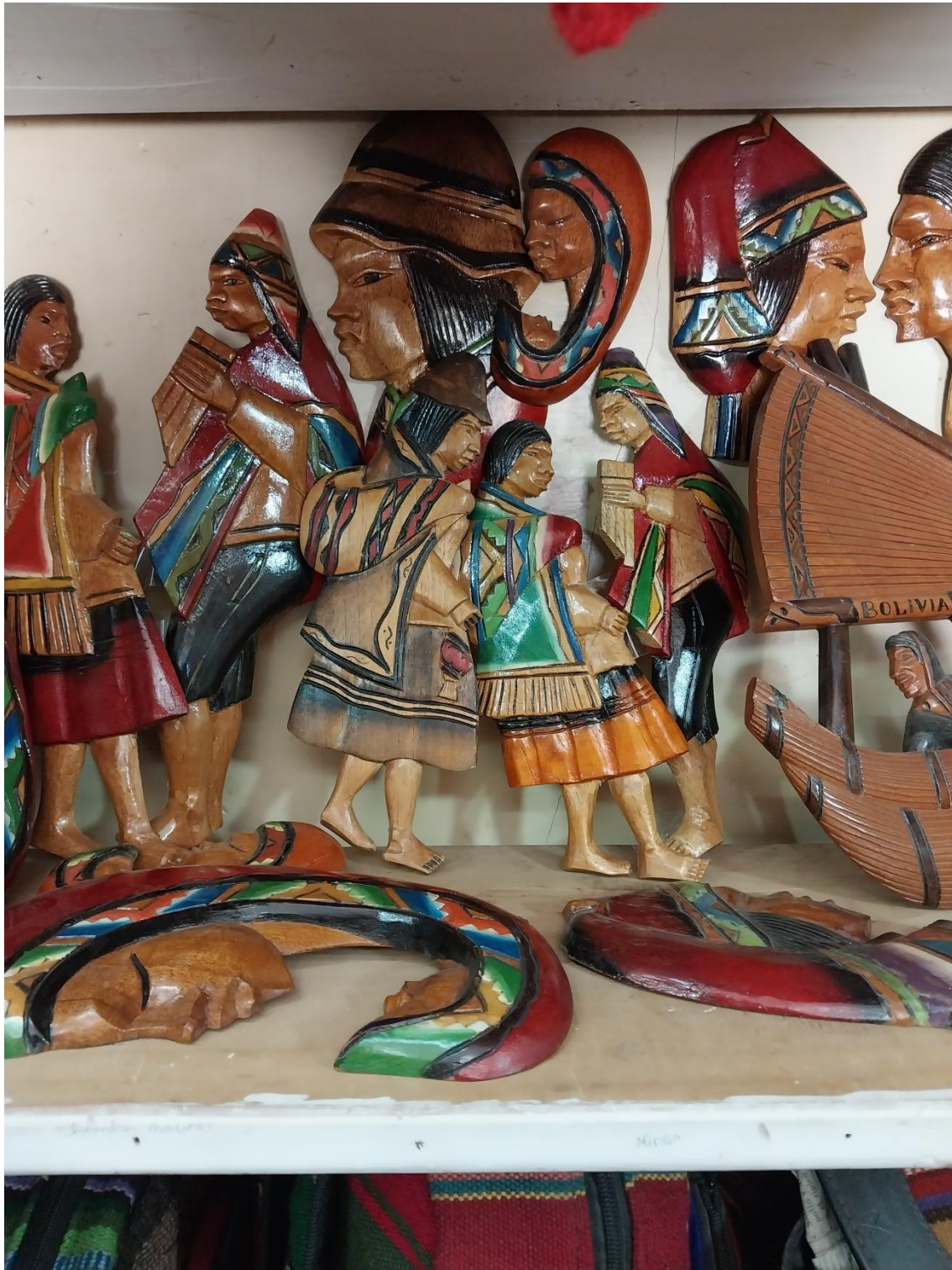
Figura 9: artesanía en madera.