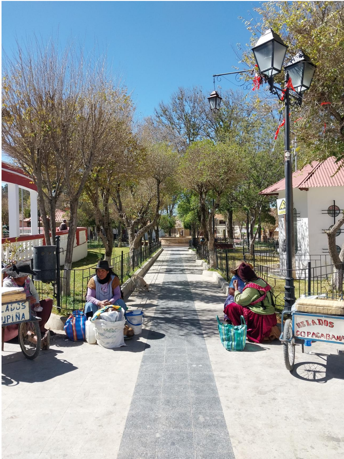
Figura 16: Vendedoras en la Plaza.