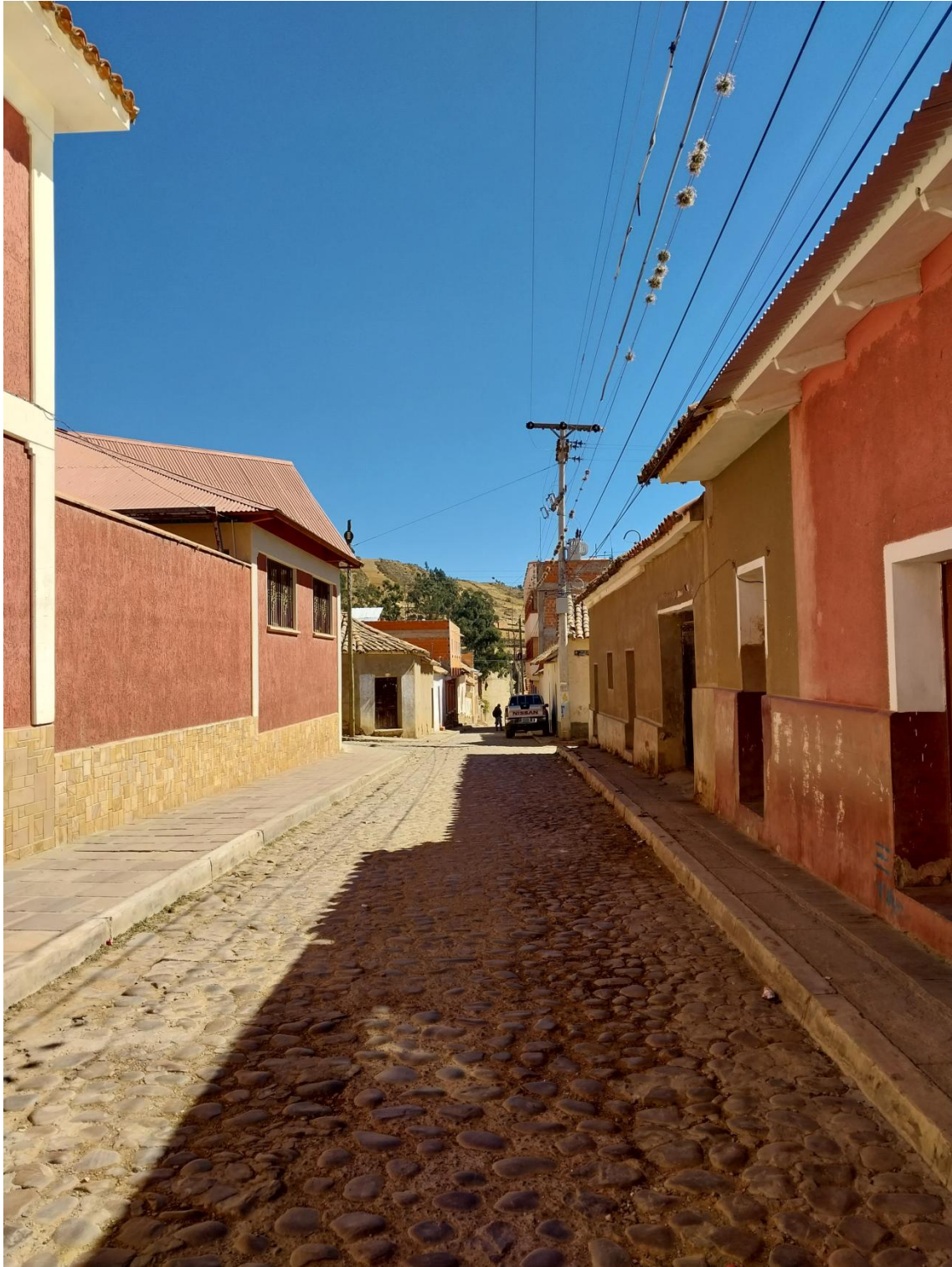
Figura 12. Calles de Tarabuco.