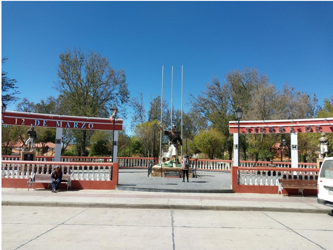
Figura 6: Monumento a la Batalla de Jumbate.