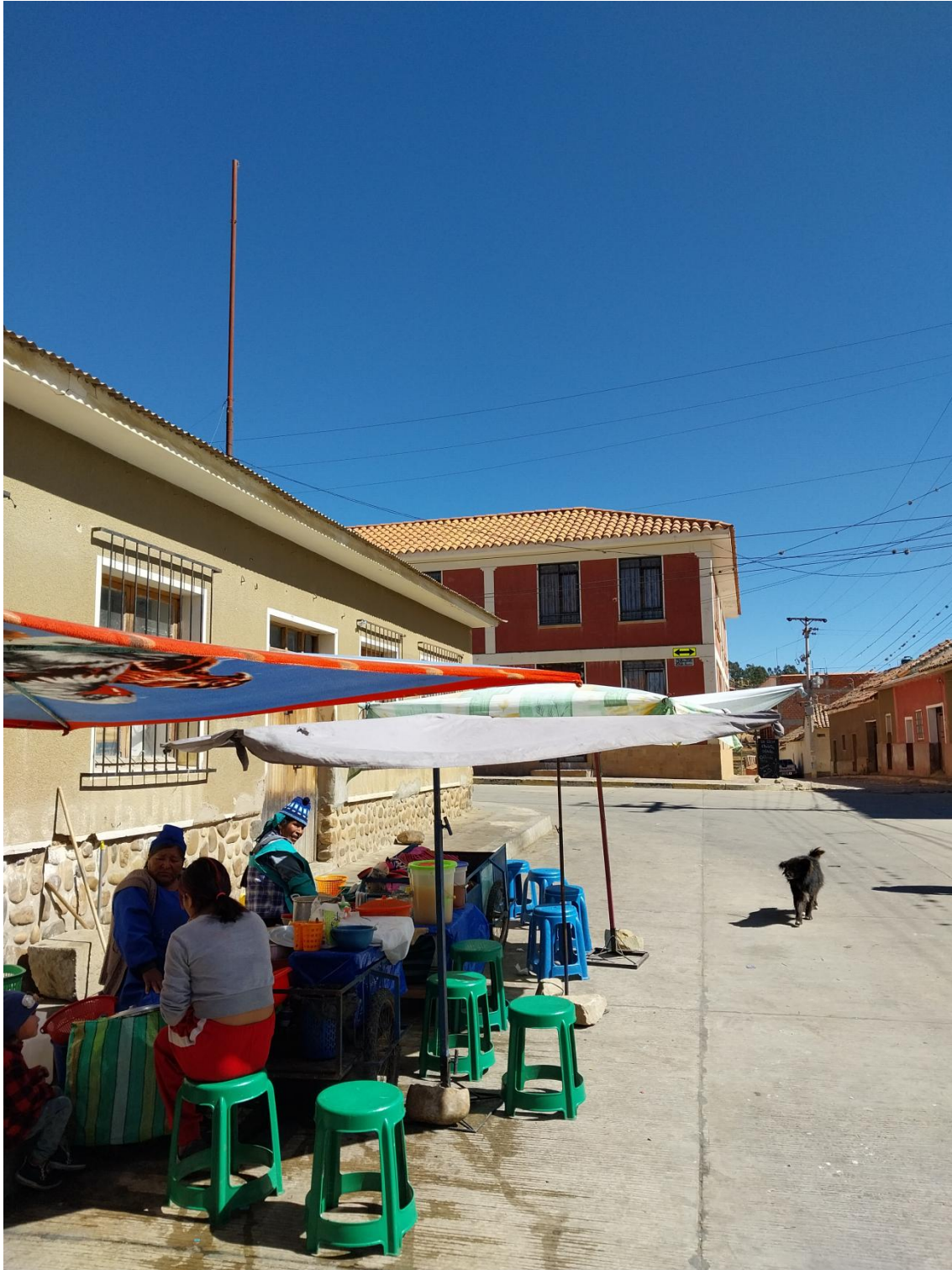
Figura 13. Calles de Tarabuco.