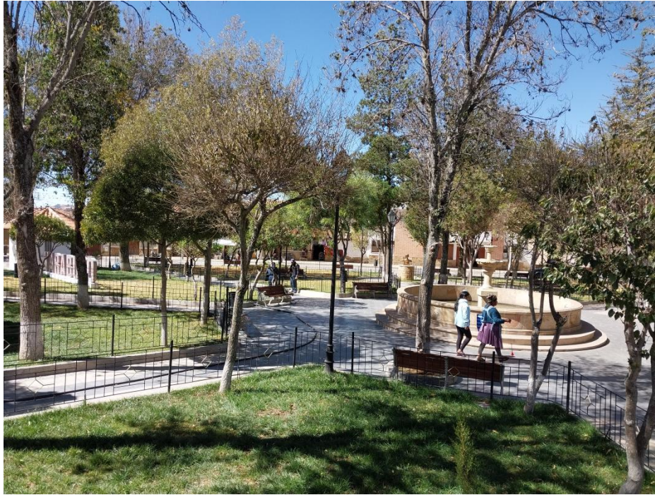
Figura 2: Plaza 12 de Marzo.