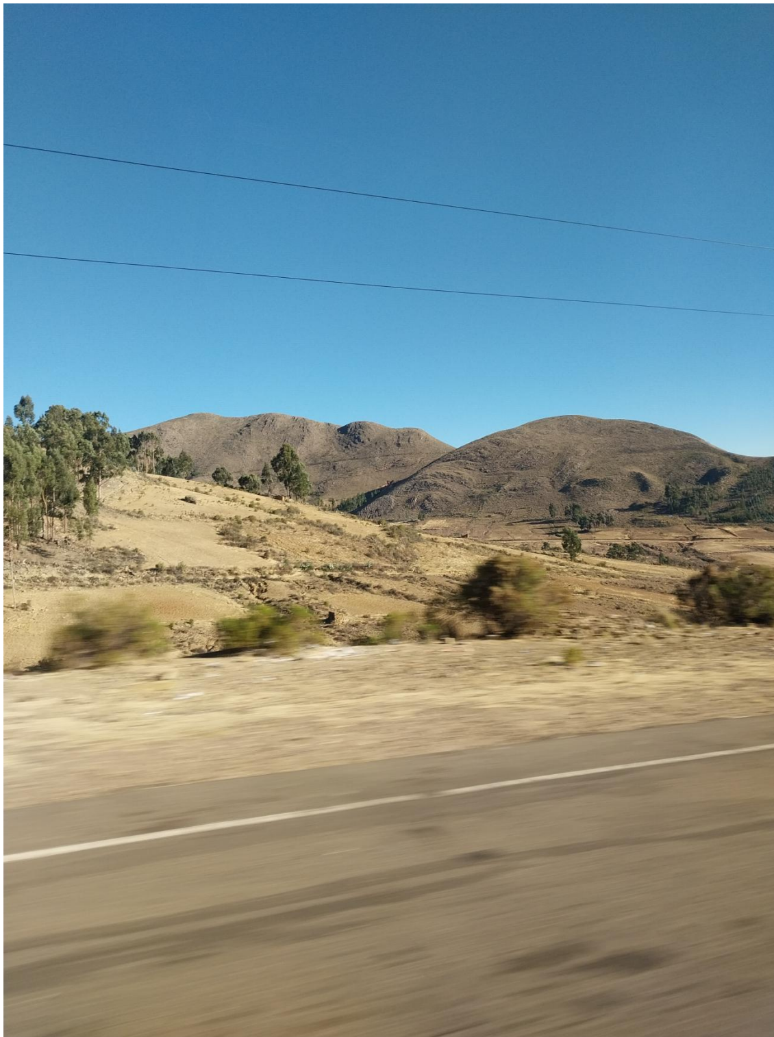
Figura 17: Tierras de Tarabuco.