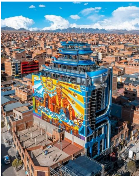
Figura 8. Cholet Crucero de los Andes: Fuente: Diario Clarín del 03/10/2023. https://www.clarin.com/viste/titanic-flota-nubes-ciudad-bolivia_0_dQwgWWaQgf.html

El arte cholet no sigue ningún canon estilístico al tiempo que se apropia de muchos. Su finalidad lo coloca en el ámbito del marketing y juega con los deseos del consumidor contemporáneo. Y su único patrón común es el gusto del dueño del cholet que encarga el diseño según su sensibilidad o gozo por alguna temática o hobby. Parece querer mostrar su subjetividad tal cual es. A esto Lipo-