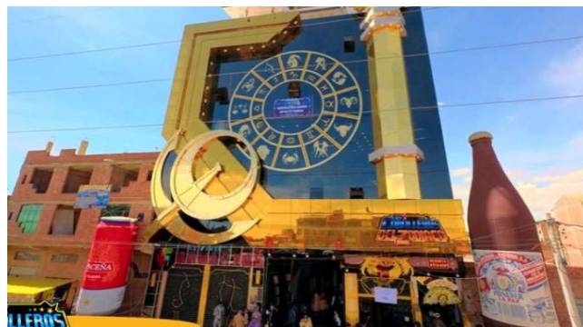
Figura 6. Cholet “Los Caballeros del Zodíaco”. Fuente: Soto (2024).

https://www.monitorexpresso.com/cholet-inspirado-en-los-caballeros-del-zodiaco-en-la-ciudad-el-alto/