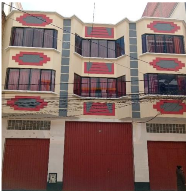
Figura 3. Cholet Cruz andina.

3) Otro conjunto destacable es el de aquellos edificios que dedican su fachada (y decoración interior) a una temática o personaje de ficción procedente del cine, la historieta o el cómic preferentemente estadounidense. Algunos autores los definen como arte futurista pero su particularidad está en la réplica de robot a gran escala mediante armaduras de policarbonato. Los más admirados son los cholet Bumblebee, salón de eventos diseñado bajo la temática del autobot de la saga fílmica Transformer (Figura 4); Iron Man, también salón de eventos y galería comercial en la planta baja que luce una fachada de aluminio