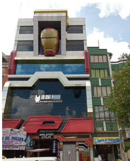
Figura 5. Cholet Iron Man.