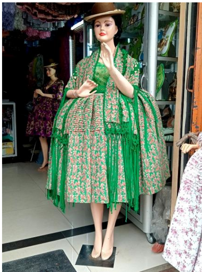
Figura 8. Vestimenta para fiestas estilo andino en El Alto.