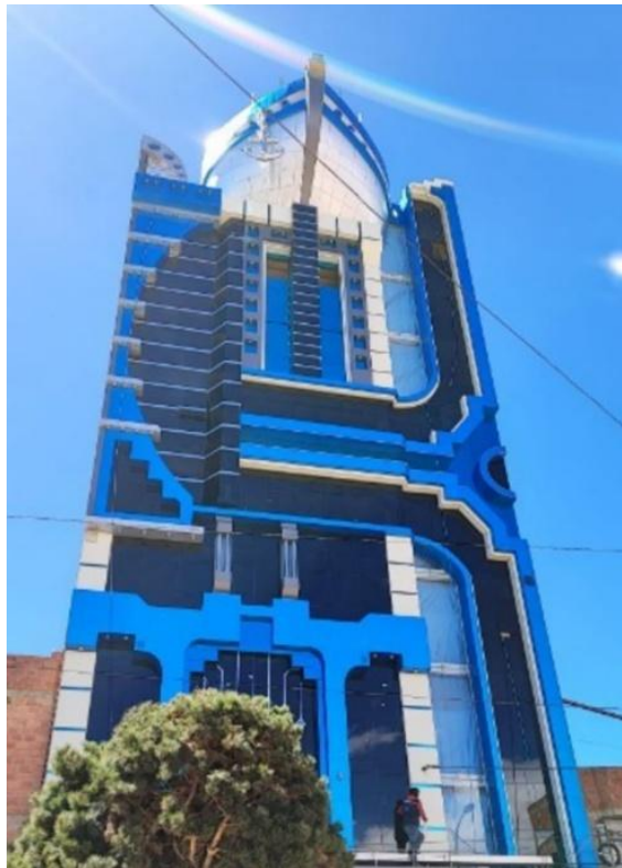
Figura 7. Cholet Crucero de los Andes: Fuente: Diario Clarín del 03/10/2023.

los pocos cholet que tienen decoración en sus paredes laterales, en este caso es un gran mural de colores vivos y saturados que representan a la Pachamama (Figuras 7 y 8).