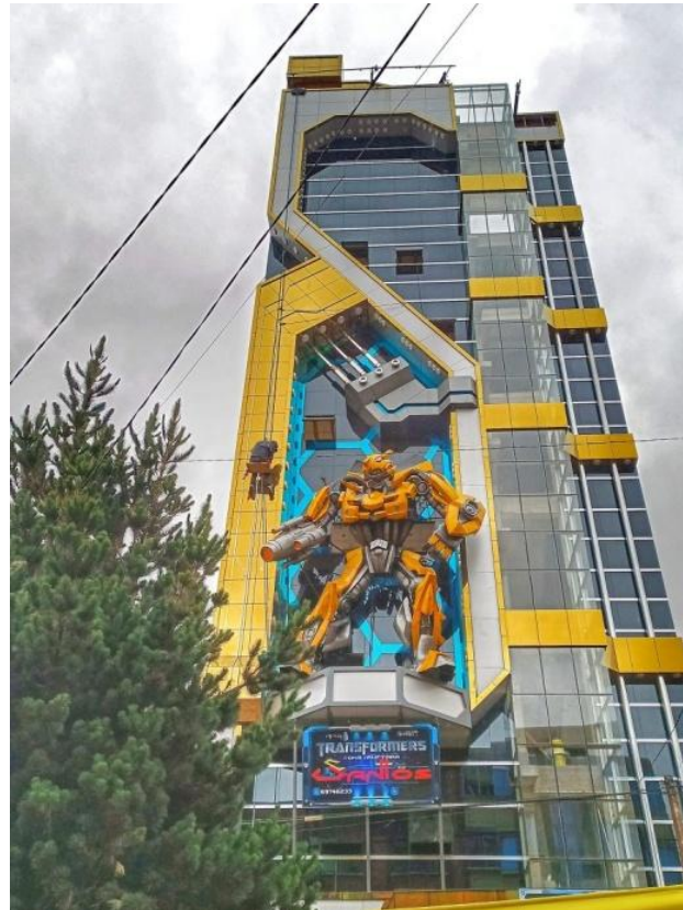
Figura 4. Cholet Bumblebee.