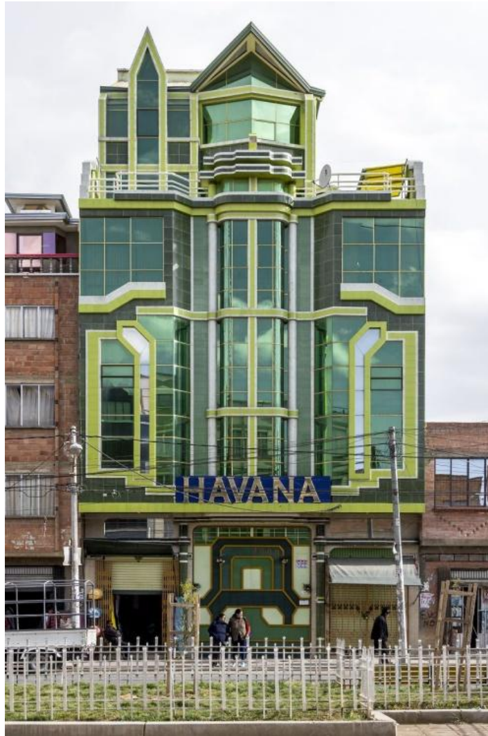
Figura 1. Cholet Havana. Fuente: Sagalerba (2022).

https://www.boredpanda.es/arquitectura-cholet-bolivia-yuri-segalerba/