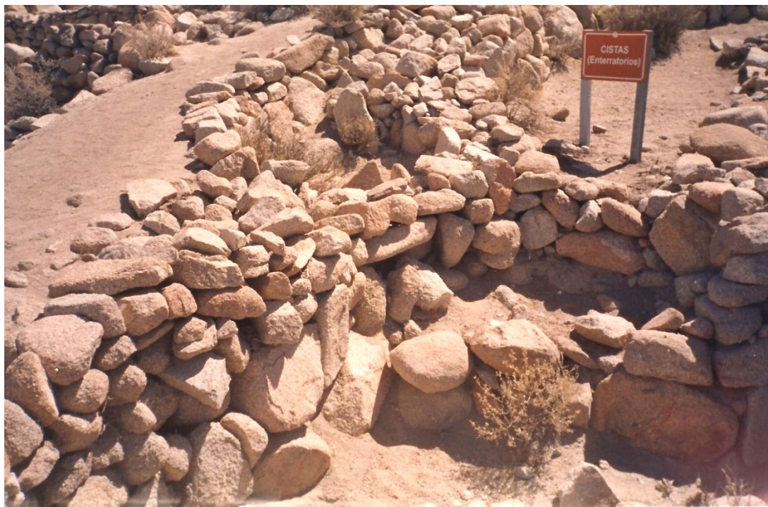
Figura 2. Cista