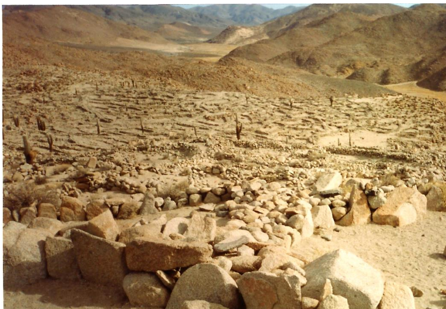
Figura 1. Vista general de Santa Rosa de Tastil

La subsistencia se basaba en la agricultura (variedades de maíz, porotos, calabazas) y la caza de camélidos. La presencia de estructuras que pudieron usarse como corrales, el grado de desarrollo de la textilería sobre la base de materias primas extraídas de la llama, la vicuña y la alpaca, los restos de camélidos domesticados, sumado a las escenas de pastoreo y encierro de camélidos en asociación con el hombre presentes frecuentemente en el arte rupestre de Tastil, lleva a sostener la hipótesis de la práctica de la ganadería de llama y/o alpaca. 2