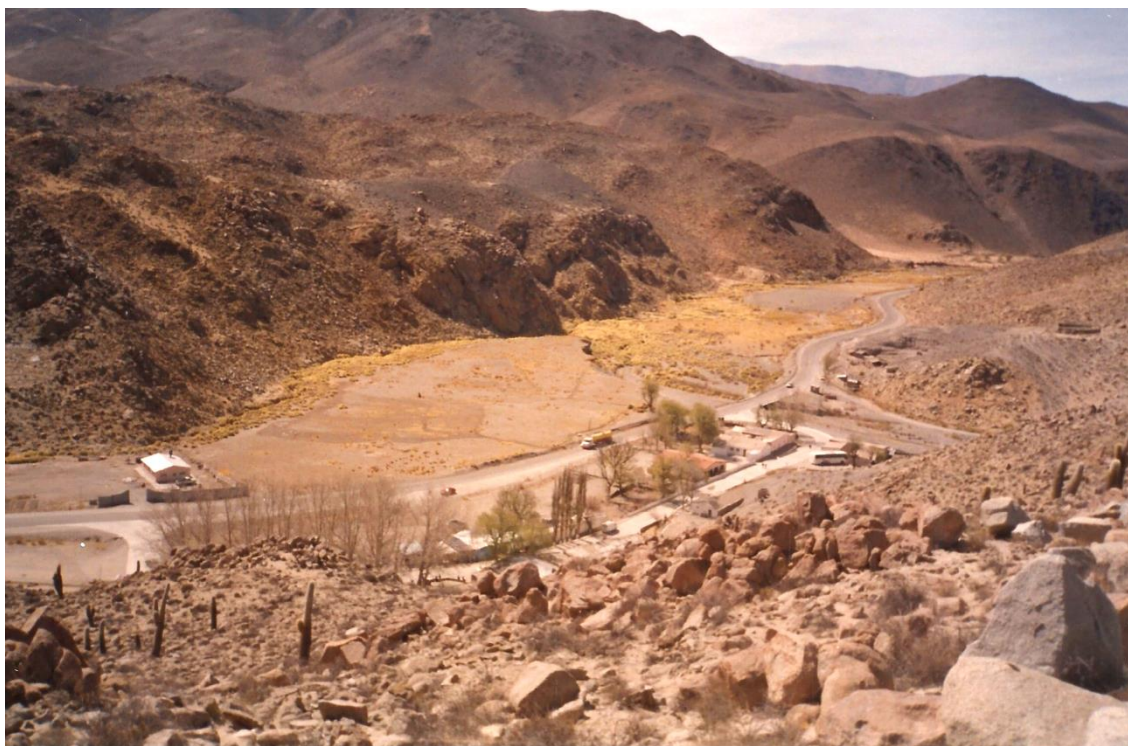
Figura 4. Quebrada del Toro