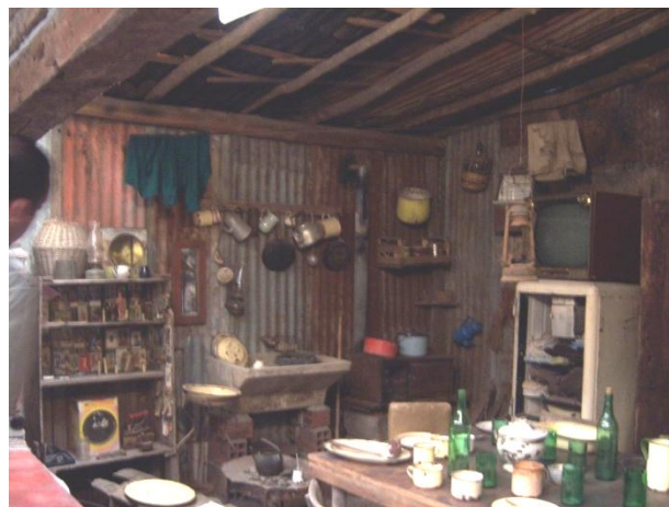
Figura 2. Sala “Lo Creado por el hombre”. Muestra Rincones. “Rincón del marginado”.

La sala “ Lo físico, lo químico y lo inorgánico ” cuenta con las temáticas Geológica y Paleontología. La segunda, “ Biología ”, abarca las colecciones Zoología, El mar, Entomología, Ornitología y Botánica. La tercera, “ El hombre como protagonista ”, está dedicada a la Antropología Física. La cuarta sala, “ Lo creado por el hombre ” incluye las secciones: Arqueología y Rincones (reconstrucciones de ambientes típicos de diferentes épocas y lugares y de niveles socioeconómicos determinados o los oficios). La quinta, “ El hombre social ”, abarca las muestras África, Bronces únicos, Juguetes antiguos, Historia de la tela y del traje, La música, La iluminación, El hombre y el tiempo, El trueque y el comercio, Armas. La última, “ El hombre y la técnica ” abarca las muestras: Una historia de la rueda, Carruajes y automóviles, Mecánica antigua, La física y la química, La radio y las telecomunicaciones, La escritura y la imprenta.