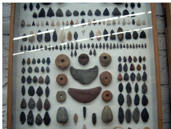
Figura 3. Sala “Lo creado por el hombre”. Muestra. Arqueología.