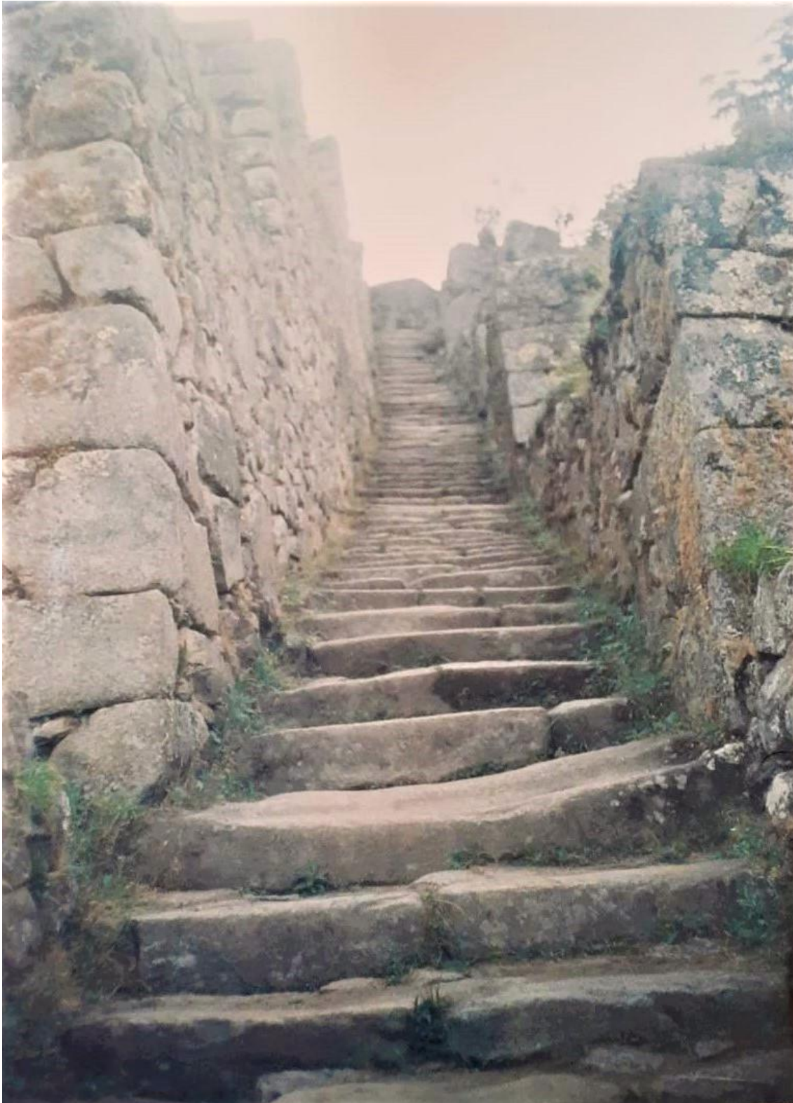
Figura 4: Escalinata.