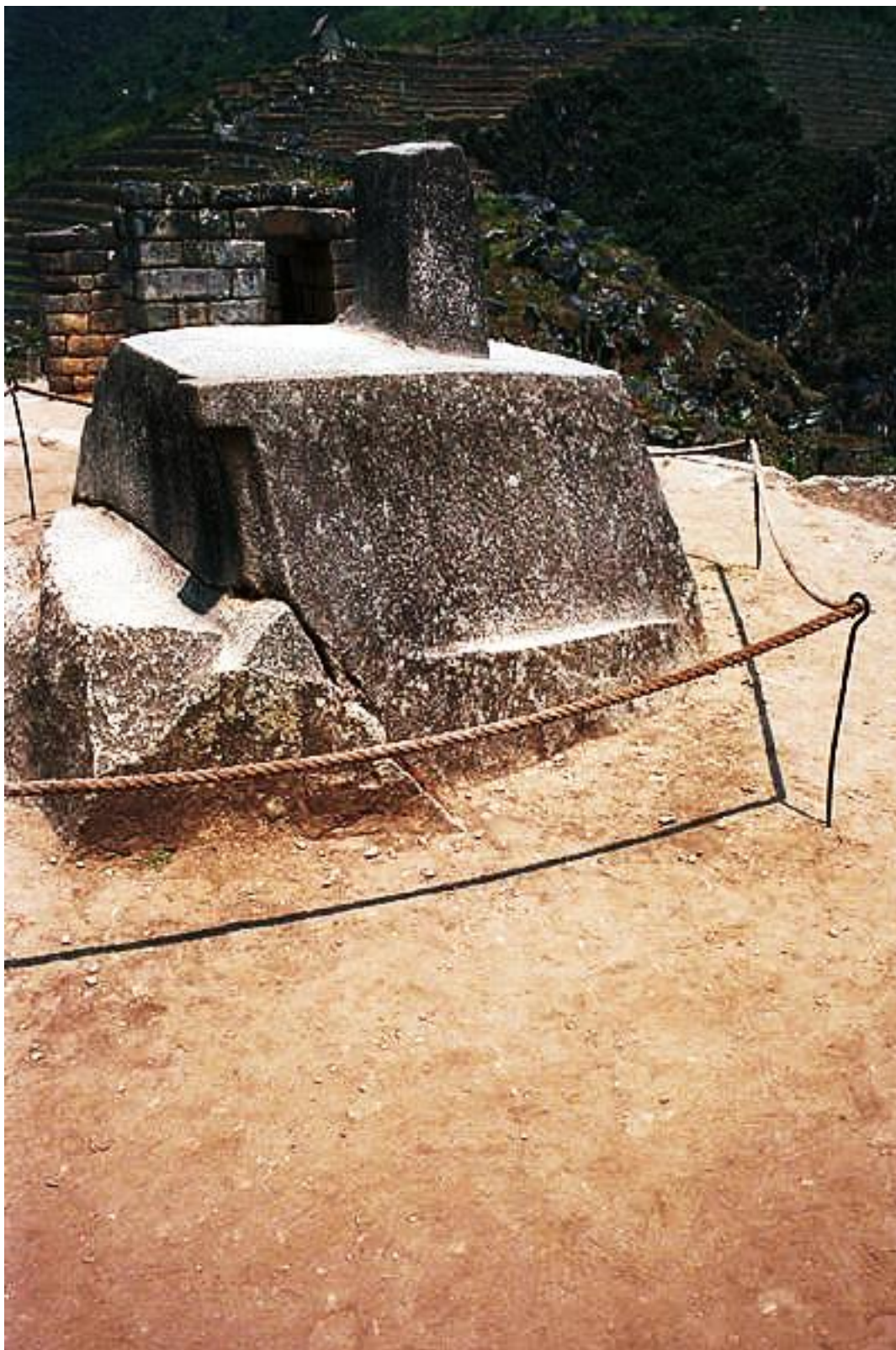
Figura 2: Intiwatana.