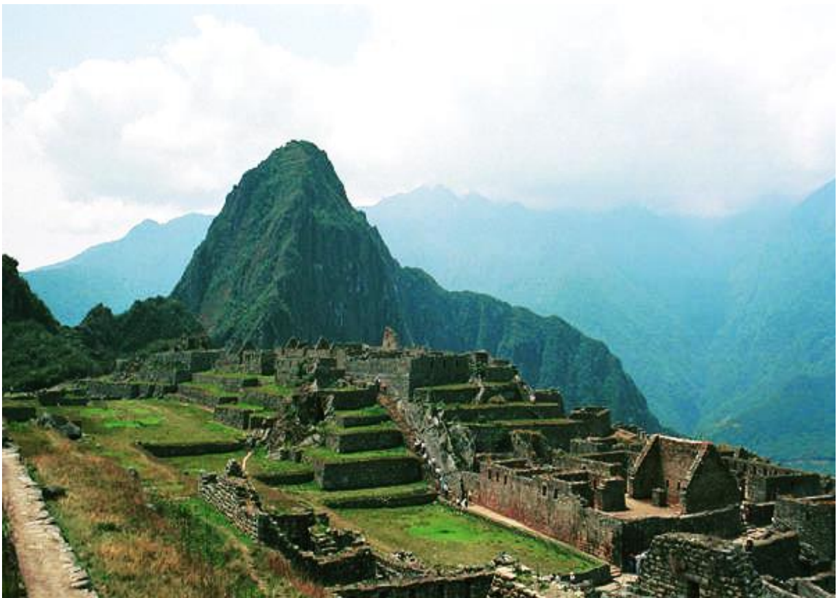
Figura 1: Vista parcial de la zona urbana.

de piedra, algunas de gran tamaño. Otro edificio del sector sagrado es el Templo de las Tres Ventanas, con su muro principal conteniendo tres ventanas trapezoidales de factura perfecta 7 .